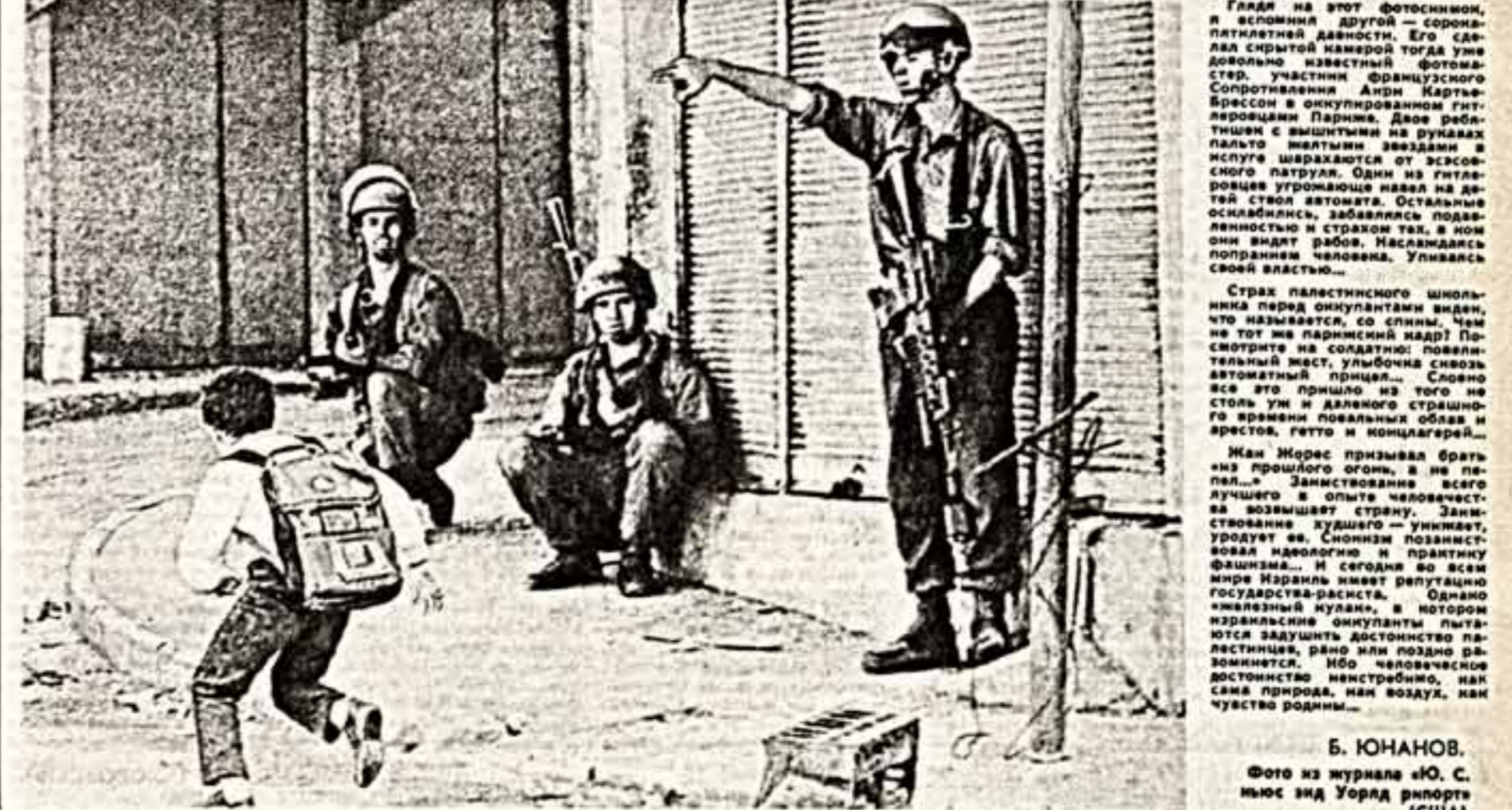
Глади на этот фотоснимок, и вспомни другой — сорванца, пятнадцатилетнего. Его сделал скрытой камерой тогда уже студент Парижского университета...

Владимир ДЖАНИБЕКОВ, летчик-космонавт СССР, дважды Герой Советского Союза.