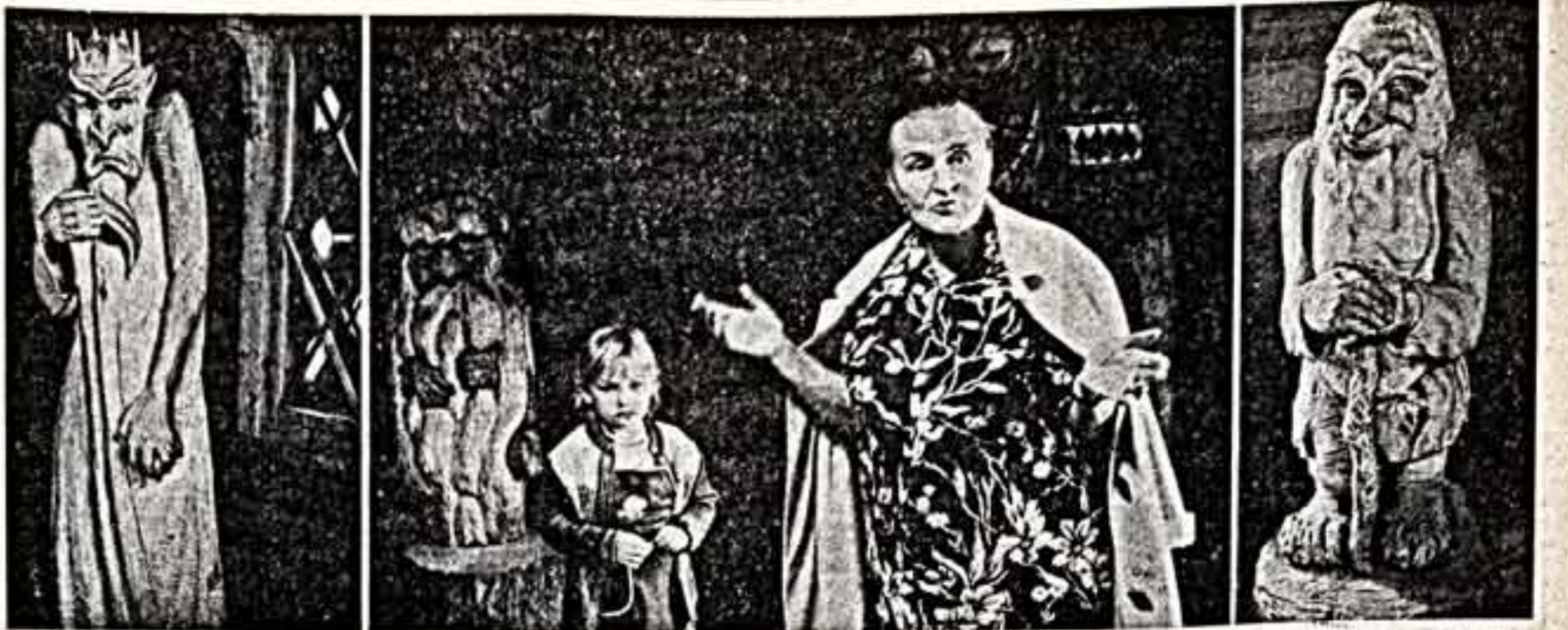
В Костромском парке «Бережков» в одном из деревянных теремов устроены музеи «Лес-чудовище». Здесь собраны забавные корны, деревянные скульптуры, выполненные как профессиональными художниками, так и любителями.