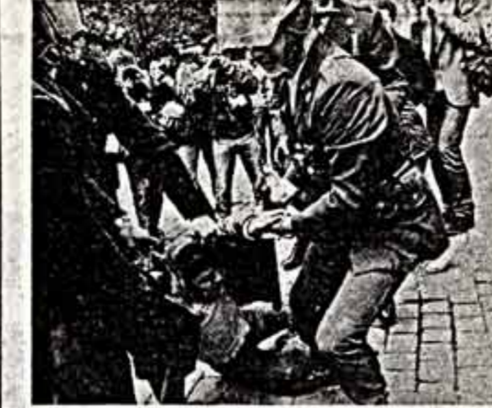
Эти две фотографии сделаны в Латинской Америке. В странах, где при военной поддержке Вашингтона и власти держатся антинародные, фашистские режимы...

Г. ГЕРАСИМОВА, корр. «Советской культуры», БУДАПЕШТ.