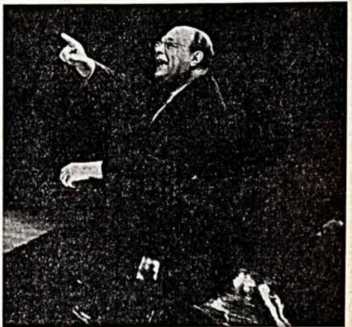
А. ГАРАННИ. «Народный артист СССР В. Сталянин ведет реставрацию «Вышневоло сода» А. Чехова». 80-е годы.