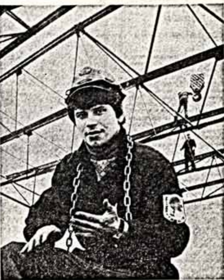
Сель работ различных жанров будут отмечены специальными призами.