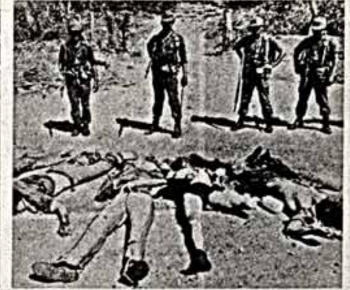
Каждый четвертый в списках убитых и пропавших без вести в Сальвадоре погиб во время партизанских операций...

А. ШАШКОВА, корр. «Советской культуры», БУДАПЕШТ.