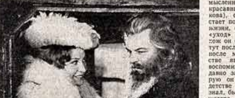
Кадр из фильма «Отец Сергей».

Сперва отец Сергей всего лишь монах, решившийся на монастырскую жизнь.