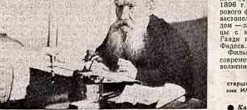
Кадр из фильма.

24-летний молодой человек, ничто еще не навлекло на Толстого, Толстой запечатлел в дневнике, что его мучит од-