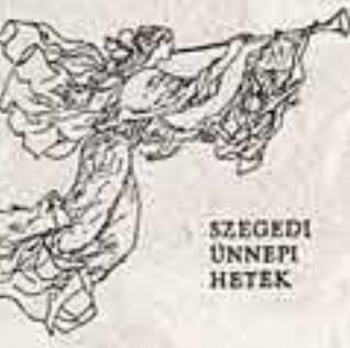
SZEGEDI UNNEPI HETEK