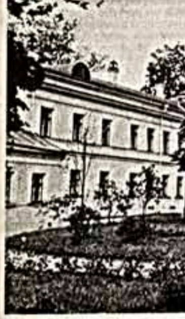
Музей музыкальной культуры дилетанты и сломаны. Для того чтобы начать, например, архитектурные исследования или реставрационные работы, дом необходимо было освободить от жильцов, а освещению их продолжились не один год. Тем временем здание разрушалось. И в этот критический момент нужно было помочь Моссовету, горком партии,

Этапы восстановления «Дома Шалыпина» Музеем музыкальной культуры дилетанты и сломаны. Для того чтобы начать, например, архитектурные исследования или реставрационные работы, дом необходимо было освободить от жильцов, а освещению их продолжились не один год. Тем временем здание разрушалось. И в этот критический момент нужно было помочь Моссовету, горком партии,