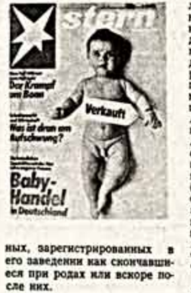
Более развитых странах «третьего мира» они используют как дешевой рабочей силы, даже в таких физически тяжелых отраслях, как горнодобывающая промышленность.

В Стамбуле в частном родильном доме д-ра Акента периодически умирали новорожденные. Г-н Акент с глубокой скорбью сообщил журналистам о постигшем их горе и ритуальных заботах брал на себя. Так длилось несколько лет, пока одна супружеская пара не потребовала предъявить им умершего сына. Однако, заполучив его, родители отказались идентифицировать младенца. Разгорелся скандал, в ходе которого следствие выявило, что на преданных пять лет д-р Акент продавал через посредников в другие страны более четырехсот новорожден-