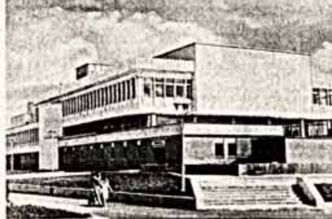
В Брянске на набережной реки Десны появилось здание оригинальной архитектуры — киноконцертный зал «Дружба». Здесь можно не только посмотреть фильм или послушать концерт, но и потанцевать, а то и просто посидеть за столиком уютного кафе, любящих на открывающийся на него прекрасный вид на реку Десну. Здание сооружено по проекту архитекторов Р. Райшера и В. Телюкова. А. ДОБКИН. Фото автора.