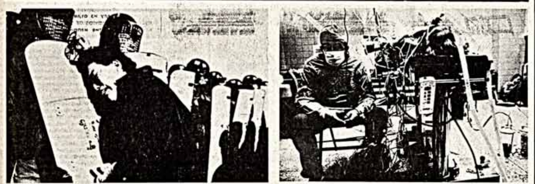
Сегодня в Московском дворце молодежи открывается Международная выставка журналистской фотографии «Горький фото-88». Организаторы выставки — фонд «Горький фото», Союз журналистов СССР, Всесоюзный центр фотожурналистики. Одновременно с экспозицией 1988 года будет показана коллекция лучших снимков за 30 лет существования фонда. • Энтони Сьюэлд. «Мать арестованного». • Джеймс Стэнфилд. «После переделки сердца».