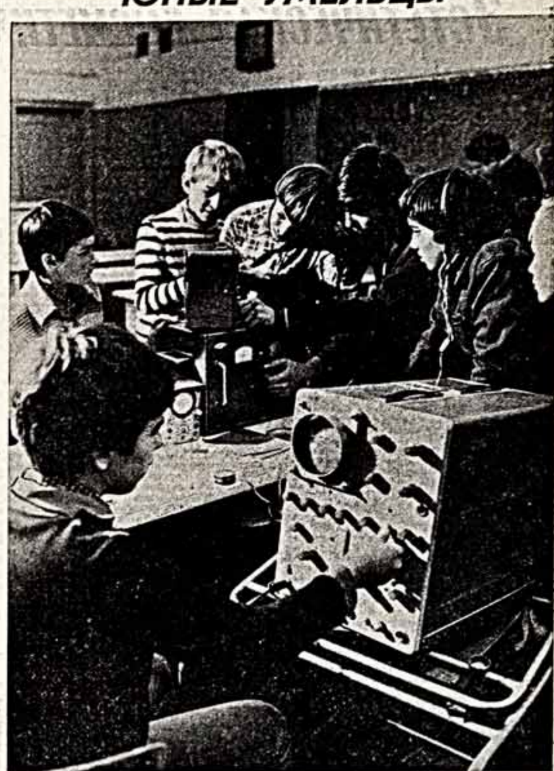
Сотни ребят ежедневно приходят заниматься в различных кружках и студиях Дома пионеров Ленинского района Москвы...