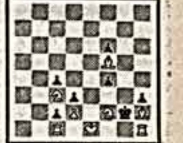
Мат в 2 хода

Автор задачи — ученик шахматной школы в Бельгурской консерватории.