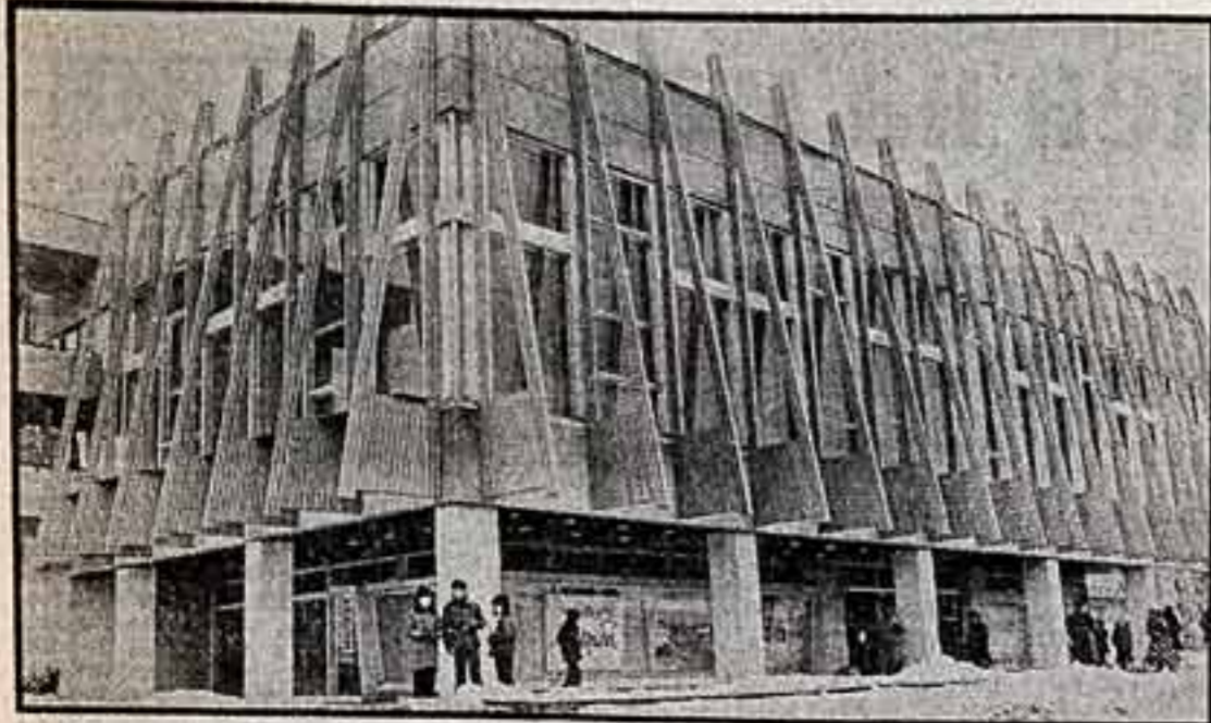
Гостеприимно распахнула свои двери новой кинотеатр «Дружба» в Воронеже. Построен он по проекту В. Дайкина, внутренние интерьеры оформил Э. Плотников.