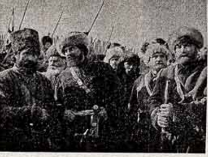
Беседу вел Э. ГРАФОВ.

Долго совещаются старшие. Но окончательное решение все же за Пугачевым. Гибнет от его руки царский король-солдат Семенов, пытаясь на глазах казаков связать «бунтовщика и смутьяна».