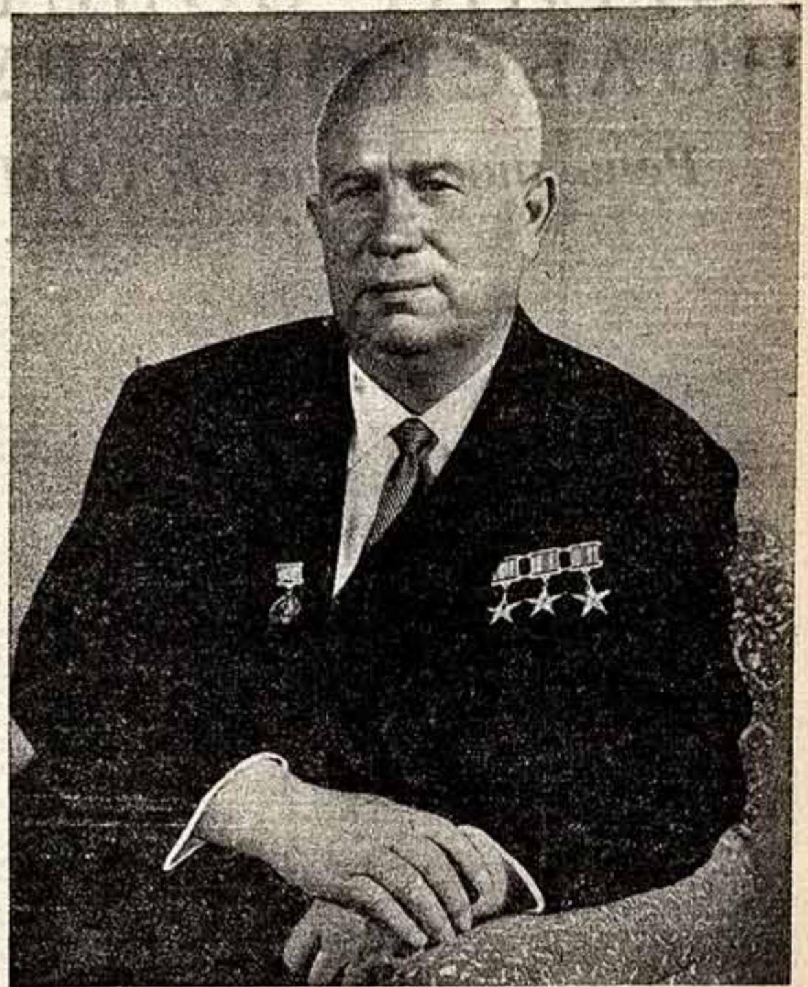
Никита Сергеевич ХРУЩЕВ.