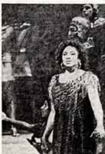
Леонтина Прайс во время прощального спектакля.

ходит в расцвете творческих сил, она достигла пика своей формы. Так почему же Прайс решила покинуть сцену? Вот что она сама говорит по этому поводу: «10 февраля мне исполнился 58 лет. И куда приятнее, когда вас