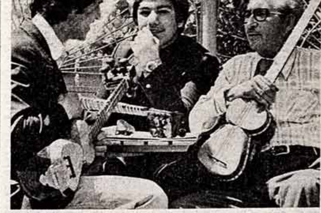
из почты редакции

А вот когда Центральной телевидением передат оперу или