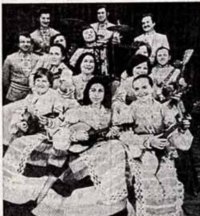
Ансамбль народных инструментов в Полоцке — один из самых популярных самодеятельных коллективов города.