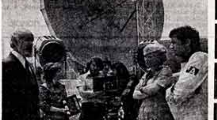
На Ятвинской киностудии идут съемки картины «Огневаз». Фильм снимает режиссер И. Вознесенский...