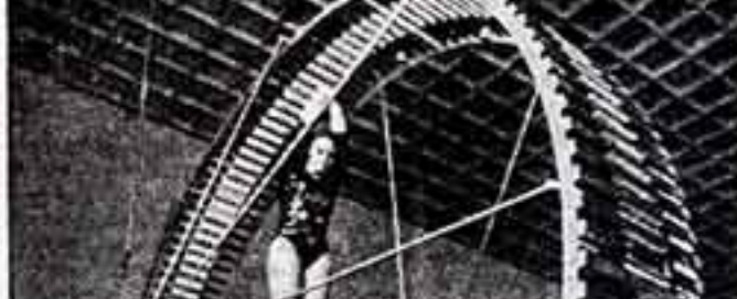
В последние годы особенно характерным для литовских кинематографистов стало стремление всесторонне расширять тему нравственного выбора жизненного пути, ответственности человека перед народом.