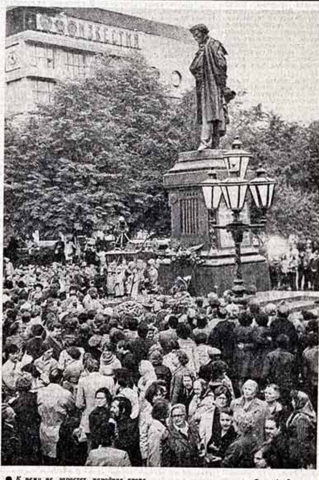
● К нему не зарастет народная тропа...

Всесоюзный пушкинский праздник завершился 6 июня в столице — в тот самый день, когда 180 лет назад здесь родился великий поэт. Он — наш современник, и сегодня, больше чем когда-либо, имя его и его стихи звучат на языках всех народов мира.