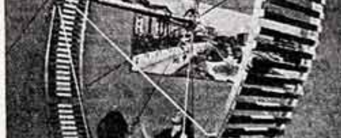
Велико влияние на духовное развитие человека музыки. В Литве появились новые симфонии, концерты, оратории, кантаты, отражающие актуальные и волнующие события жизни.