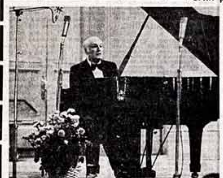
В Большом зале столичной консерватории с огромным успехом прошел концерт народного артиста СССР Святослава Рихтера...

«Полжид провинциальный Каленчик, грозящий в пламени мировой войны, забюкуются в какой-то селенчик, героиня ведет счет совести, счет жизни, счет тому, что сохранила на своем почти шестидесятилетнем пути, что могла совершить на что не хватало ей сил, смелости, характера, обстоятельности...»