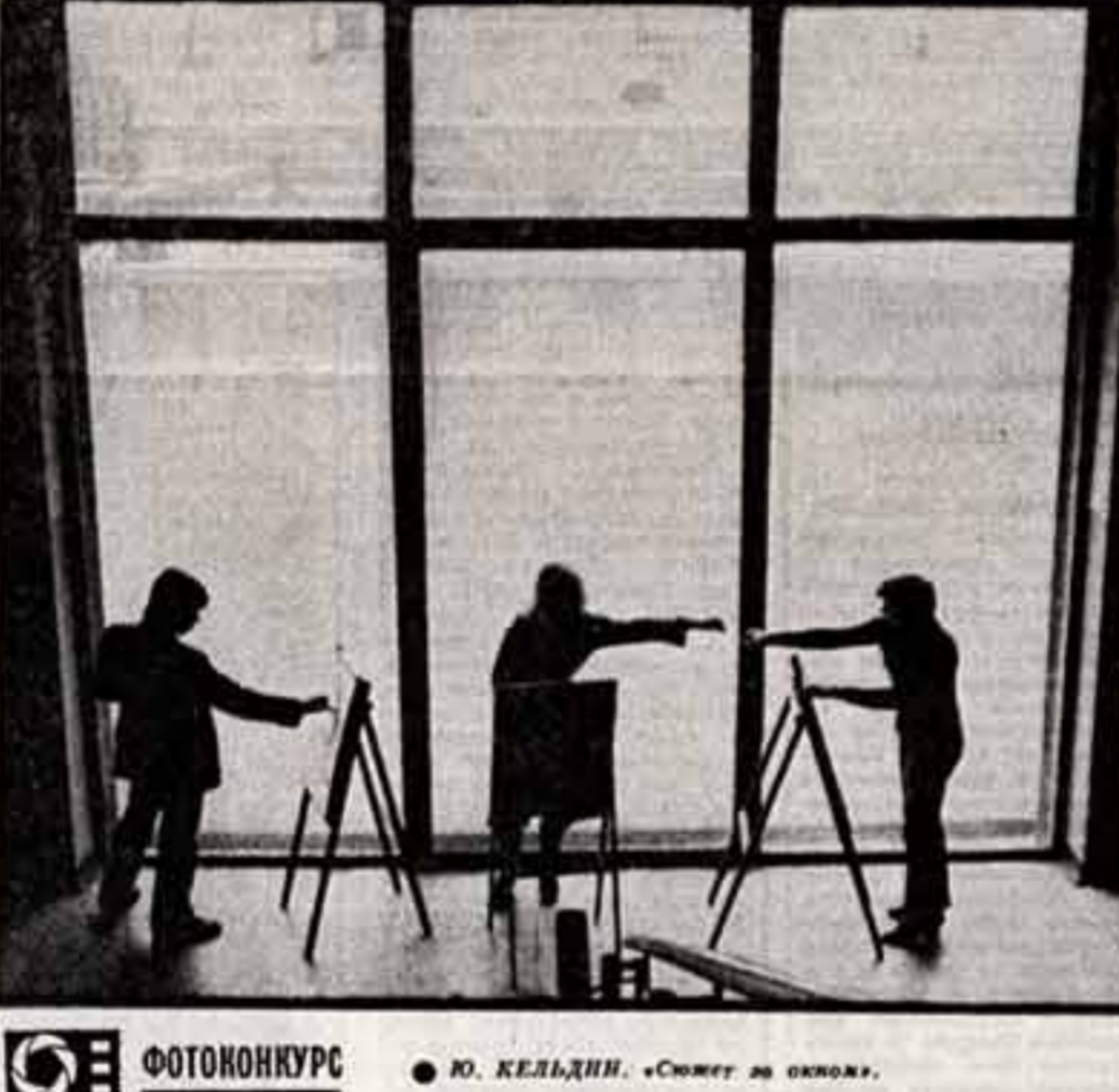
ФОТОКОНКУРС Ю. КЕЛЬДИН. «Сюжет за окном».

многих спектаклях, предломили роль в его фильме по пьесе Л. Зорина «Транзит»... Ю. КЕЛЬДИН, «Сюжет за окном».