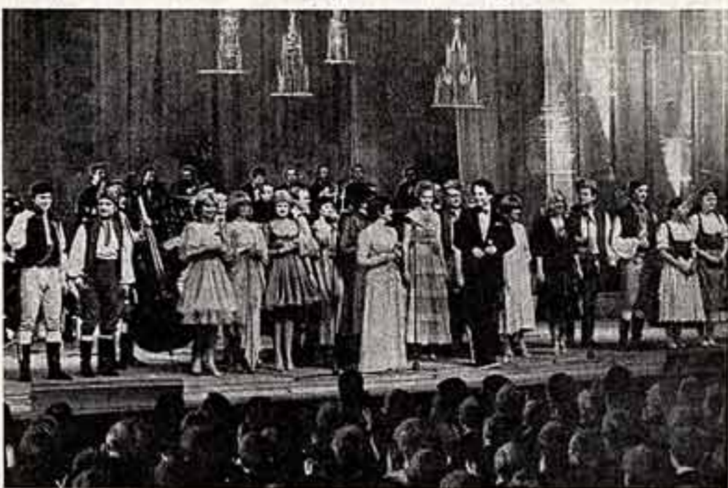
На сцене артисты Праги и Москвиты — участники праздничного концерта.