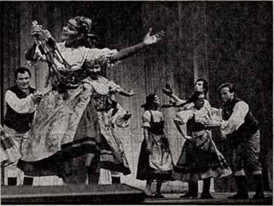
Выступает самодеятельный фольклорный ансамбль «Китице» завода ТЕСЛА.