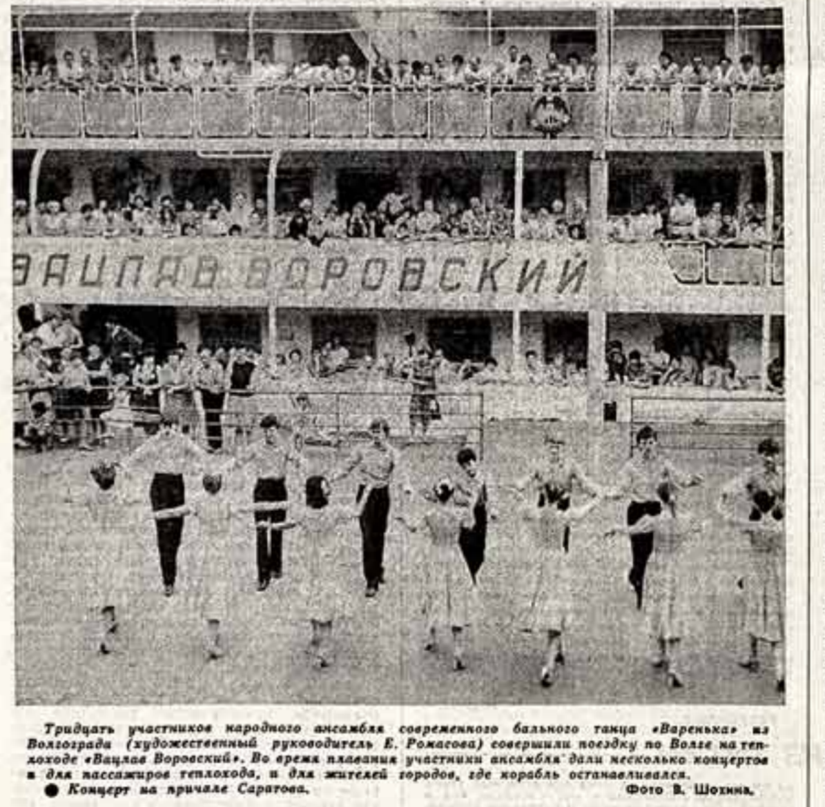
Тридцать участников народного ансамбля современного балетного танца «Варьетка» из Вологодской области (художественный руководитель Е. Рожкова) совершили поездку по Воле на теплоходе «Валдай Воронежский». Во время плавания участники ансамбля дали несколько концертов в два пассажирских теплохода, и для жителей городов, где корабль останавливался.

В. КЛЕНИН, наш спец. корр. МОЖАЙСК — ЧЕХОВ — МОСКВА.