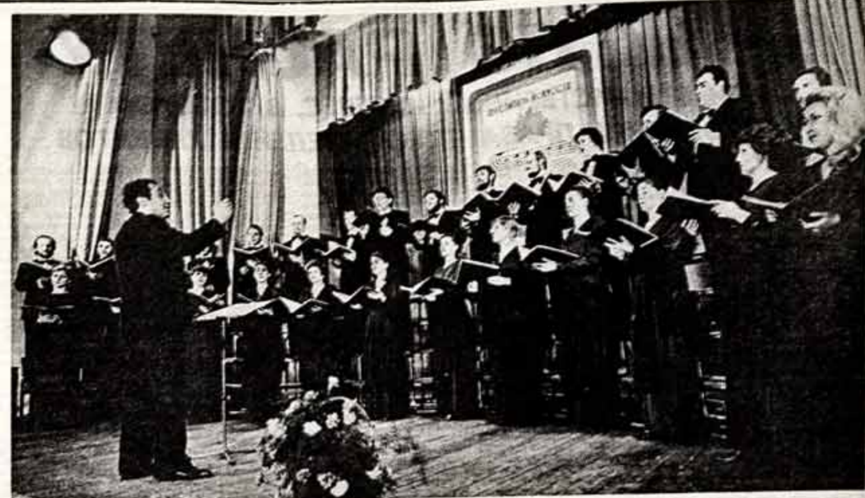
Э. НИКОЛОВ. «Поет хор в Сибиря». (Новосибирский камерный хор).

Музыка, как известно, — искусство социальное. Она может объединять людей, а может их разобщать. Она может возвышать человека, поднимать его нравственный облик человека. Но разная музыка делает это по-разному. Поэтому и надо воспитывать у молодежи вкус и настоящей музыке, приучать ее к серьезным — классическим и современным — сочинениям, всеми средствами поднимать художественный уровень эстрадной легкой музыки. Большую помощь в этом могут