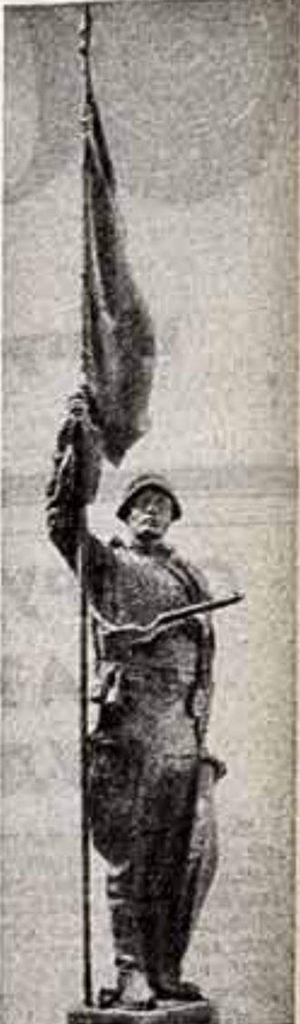
Три победы гвардии лейтенанта