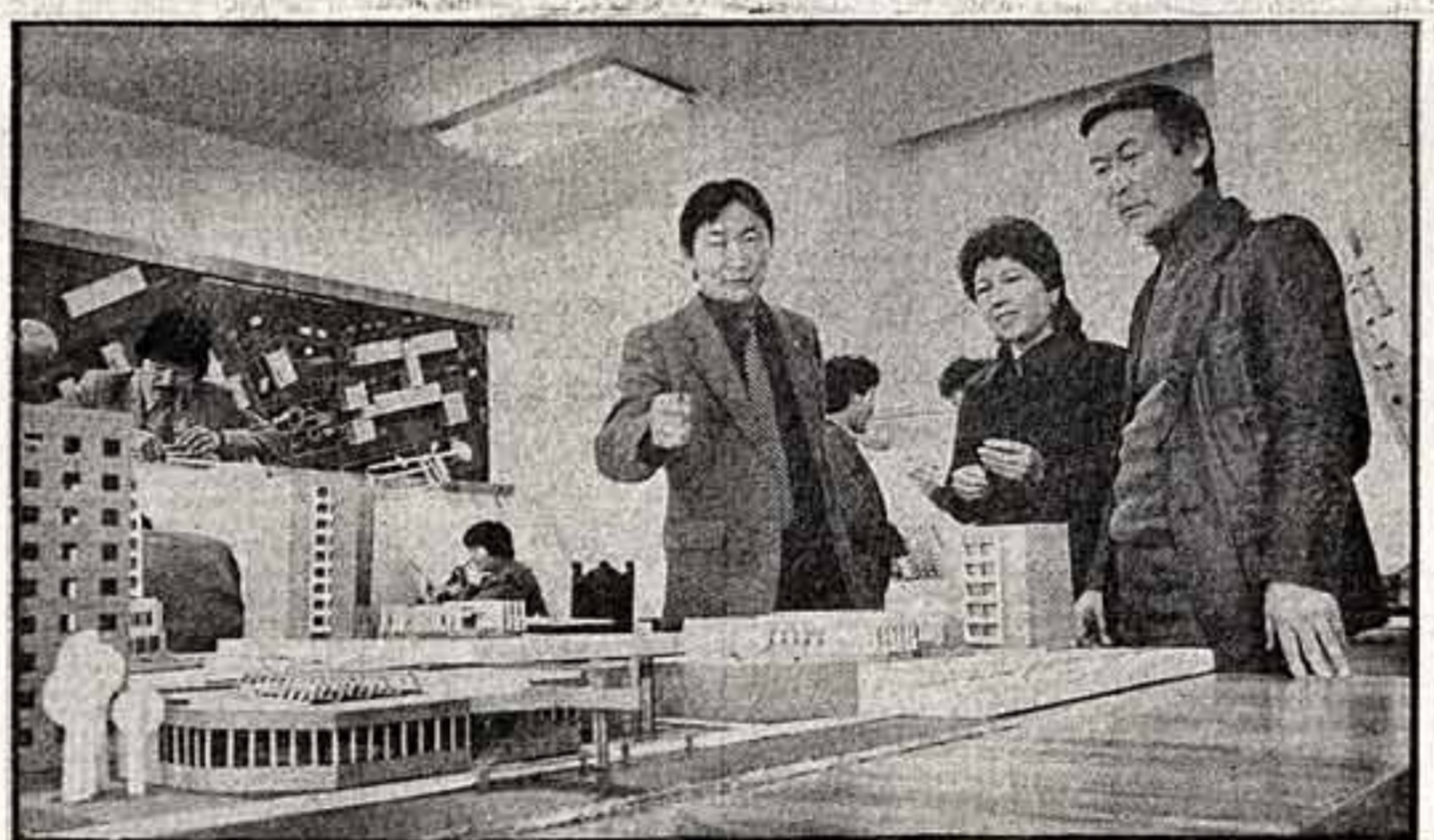
Архитекторы и проектировщики института «Якутградпроект» много делают для того, чтобы придать красочный, современный облик городам своего края...