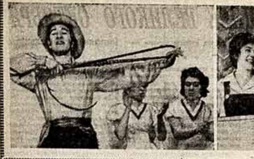
Смотря агитбригады. На снимках: 1. Выступление агитбригады Менделеевского районного дома культуры Татарской АССР...