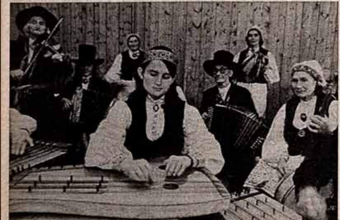
Тырская сельская колхоза — один из клубов народных музыкальных коллективов, возникших в Эстонии за последние годы. В составе ансамбля — летучие старики и молодцы. В репертуаре коллектива — эстонская, латышская, русские народные мелодии.

Т. АБАКУМОВСКАЯ, наш соб. корр. Витебская область.