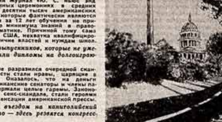
Рисунки из журнала «Ю. С. Нью энд уорлд рипорт» и «Ньюспун» (США).