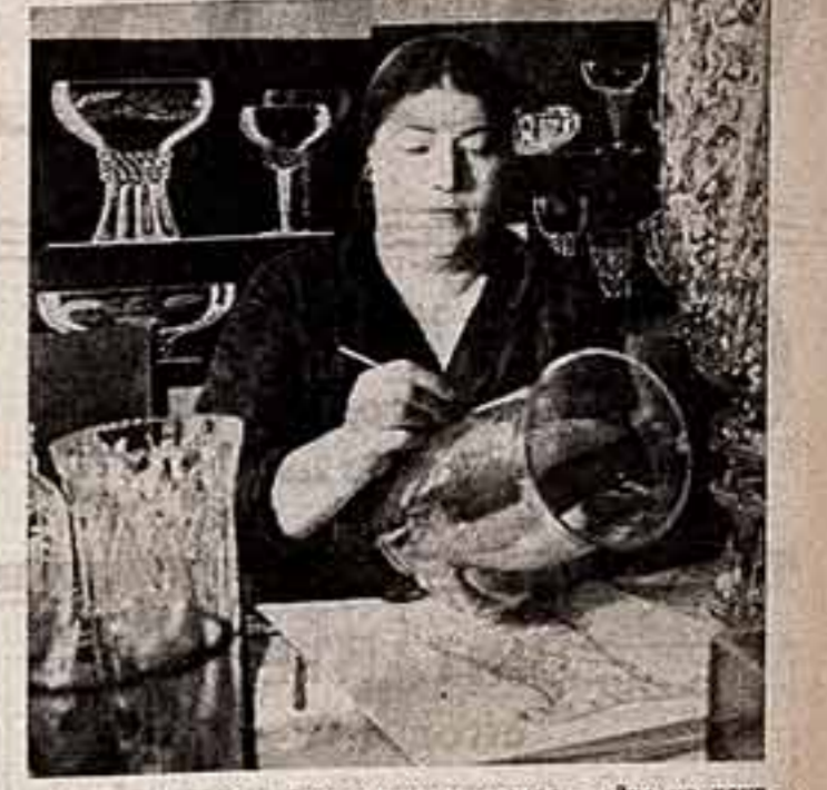
Киеский завод художественного стекла — одно из крупнейших предприятий Советской страны. Более 180 видов изделий из стекла и хрустала — вазы, конфетницы, фужеры, самые разнообразные по художественной форме и приемы исполнения — выйдут из его цехов.

«Пятилетка качества» — творчество каждого работника — этому было посвящено партийное собрание в Геленджикском бюро путешествий и экскурсий.