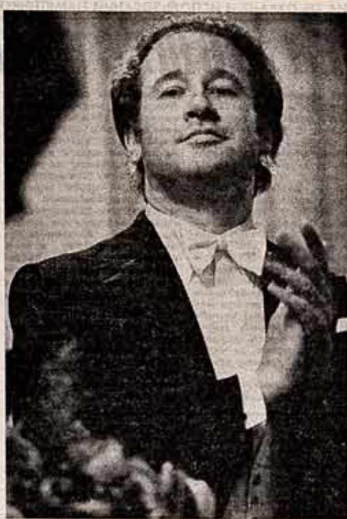
В. АХЛОМОВ. «Талант и поклонники». (На теоретическом вечере народного артиста СССР Е. Нестеренко).