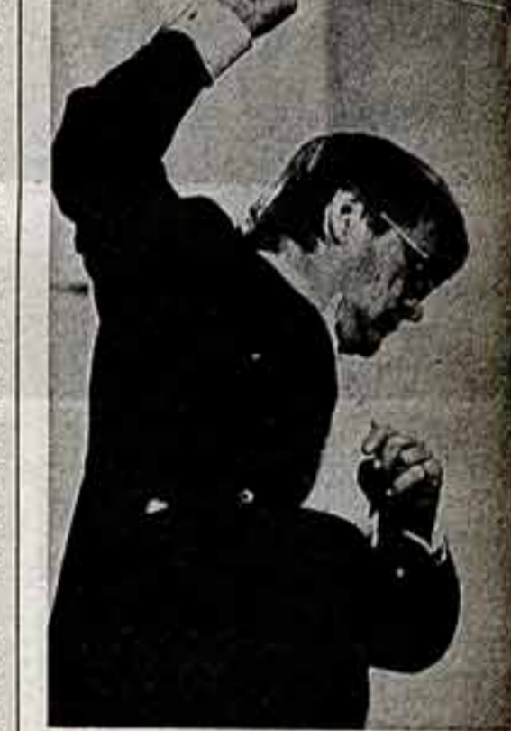
Фотоконкурс. А. БОЧНИН. «В мире звуков».

Телевидение и живопись. Как складываются взаимоотношения самого молодого и самого древнего видов искусства!