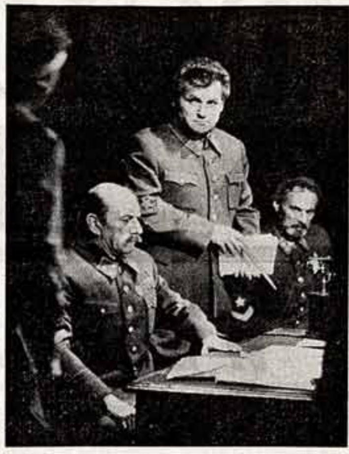
Государственный академический украинский драматический театр имени Шевченко...