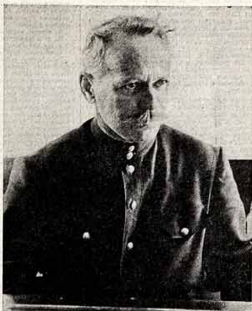
М. Шолохов, станица ВЕШЕНСКАЯ. ● М. А. Шолохов среди литераторов — делегатов IV съезда писателей. ● М. А. Шолохов с женой. ● М. А. Шолохов во время отдыха.

Родился в 1905 году 24 мая в хуторе Крутицкое станицы Вешенской, бывшей Области Войска Донского. Отец — русский, мать — украинка. До 1918 года учился — сначала в приходской школе, потом в гимназии, но начавшаяся в ту пору гражданская война прервала мое учение, и с 1918-го стал работать. Служил в станичной полиции, в ЧОИЕ — в Частях особого назначения, в профотряде, работал грузчиком, чернорабочим. За пять лет переменял много профессий. С 1923 года стал печататься. С того времени литературная деятельность стала моей основной профессией в жизни.