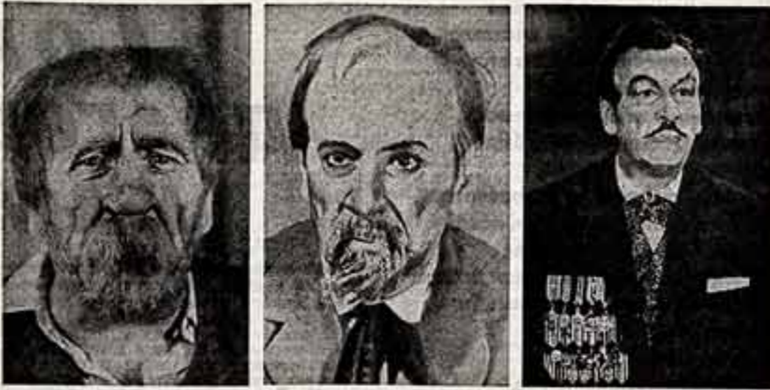
Ростислав Плятт, народный артист СССР