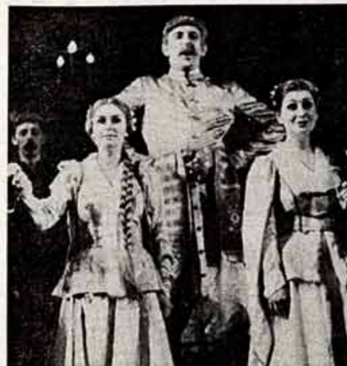
В Москве с большим успехом проходит гастроли оперной труппы Большого театра Польской Народной Республики.