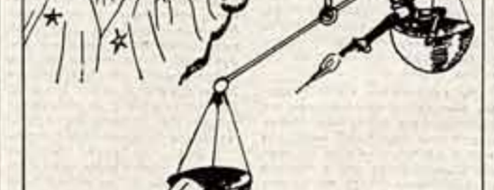
Список опасных профессий в буржуазном мире...