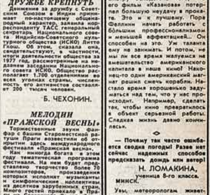
Федерико Феллини готовится снимать новый фильм 'Города-братья'...