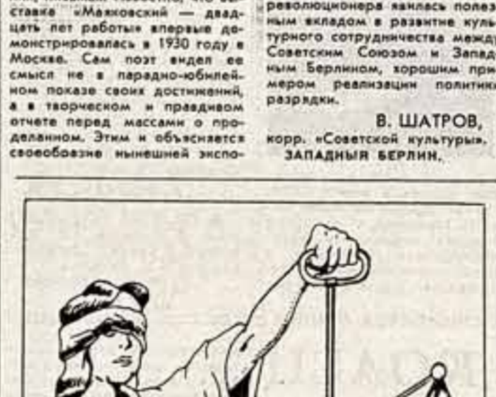
Этой карикатурой нью-йоркский журнал 'Воскresenie'...