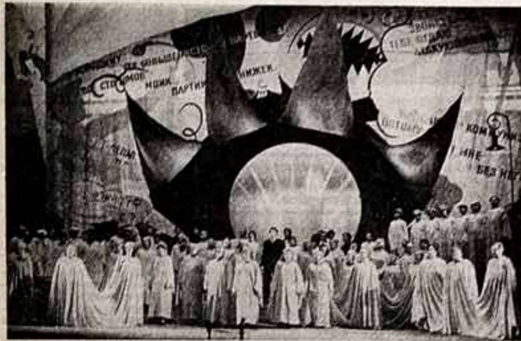
Первый полет нового мира, посвященный своей могучей талант Одибери...