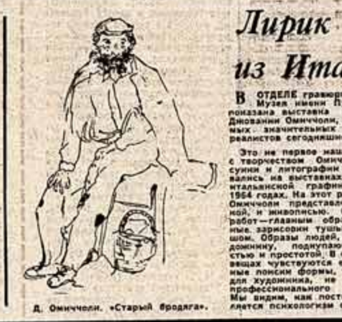
Д. Омиччи, «Старый бродяга».