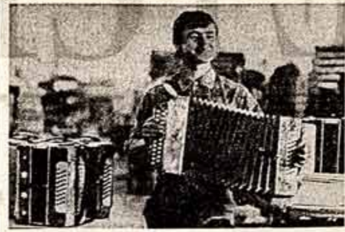
Гармонная фабричная фабрика — единственная в нашей стране — выпускает гармонные инструменты в городе Кирово...