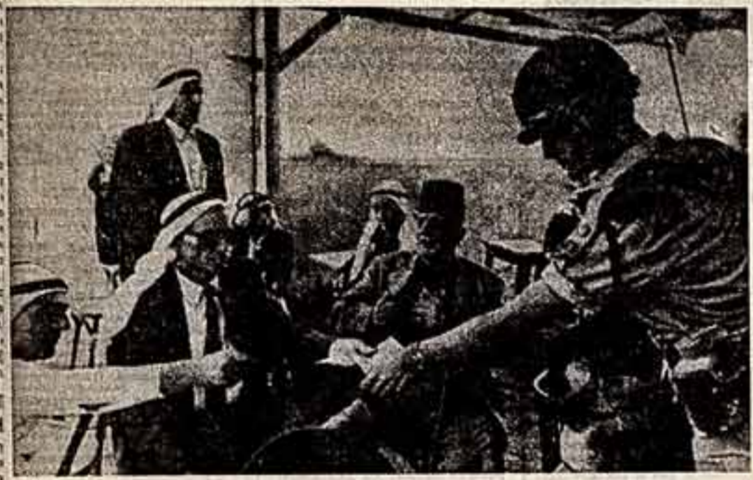
Одна из разновидностей современного расизма — шовинизм. Постоянная дискриминация подвергается население жестоко оккупированных израильской оккупационной территории арабских государств. Гражданин высшего сорта чувствует себя арабом, живущим в самом Израиле.

В целом у меня сложилось несколько странное впечатление, что французский театр в последние время сильно ушел от реальности, ушел от жизни, ушел от возможности. Сцены и зрительские залы оборудованы очень современно, хорошо механизированы, зрители по воле режиссера могут по приблизности к сцене, то обогнуть ее, то отдалиться. Я не в восторге от таких шумных механизированных зрелищ. В театре я хочу видеть, почувствовать, а не увидеть. Мой театр — камерный, психологический, театр мысли и чувства, человеческие переживания. Театр для меня — это прежде всего человек со своей печалью и счастьем, со своими горестями и радостями. Такой театр я выбрал в кино, стараюсь быть ему верным по своей натуре, помогаю зрители познакомиться с собой, постигнуть смысл существования, разбудить тягу к добру и красоте. Сколько современного человека получает информации! Помочь человеку не потерять себя, обогреть его, заставить взглянуть со стороны на себя — это в силе театра, это его задача.