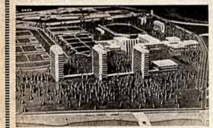
Макет центральной базы для подготовки сборных команд в Сузуме. Проект разработан группой под руководством В. Цветкова и Л. Васильева.

Комплекс современных спортивных сооружений для подготовки сборных команд начнется строительство в этом году.