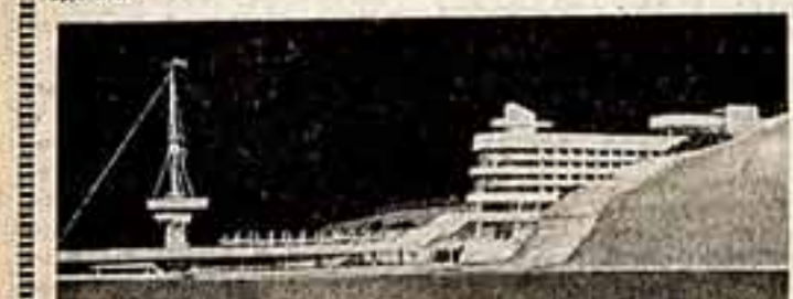
Так будет выглядеть учебно-тренировочная база «Дельфин». Руководитель авторской группы проекта А. Кузнецов.

Легкое, ажурное здание, позволяющее очертанникам на корабль, вырвется в скором времени на берег Черного моря в поселке Судак Крымской области.