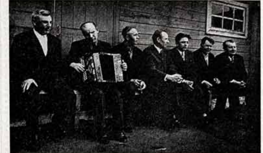
Мужские посиделки. Бабушка и внук.

Человек беспокойный, он возглавляет фотоклуб, созданный при объединении. Это весьма весомый вклад в дело повышения мастерства коллег Кудринского.