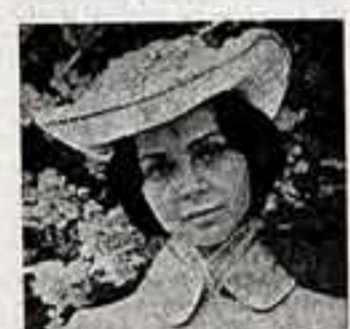
туфлях на высоком наблуде, доказывая сомневающимся девкам-ученицам, что знаменитая Павлова умеет все...