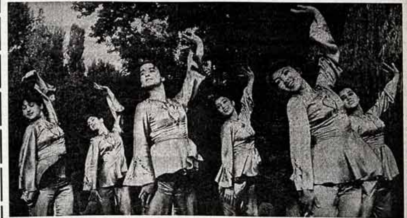
Танцует ансамбль Гостелерадио Таджикистана «Зебу».