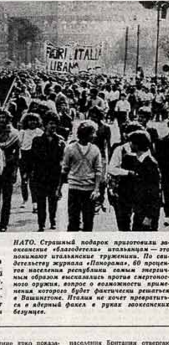
Италия. Страхный подарок приготовили заокеанские «благодетели» итальянцам — это помпезный итальянский транспортный самолет...