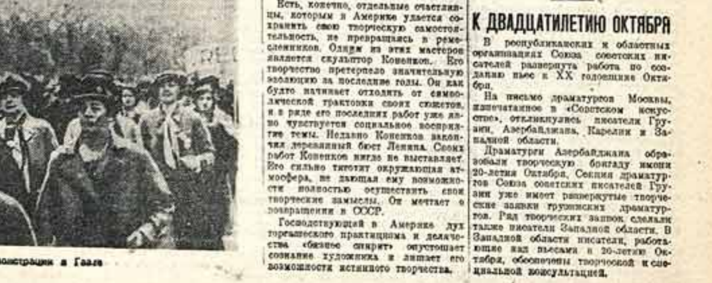
Концерт актрисы в женской демонстрации в Гае