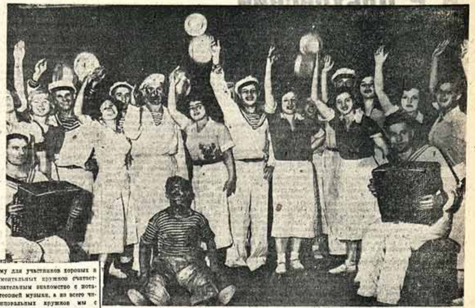
Олимпиада Музыки и Танца. Театральный коллектив рабочих Электромонтажа