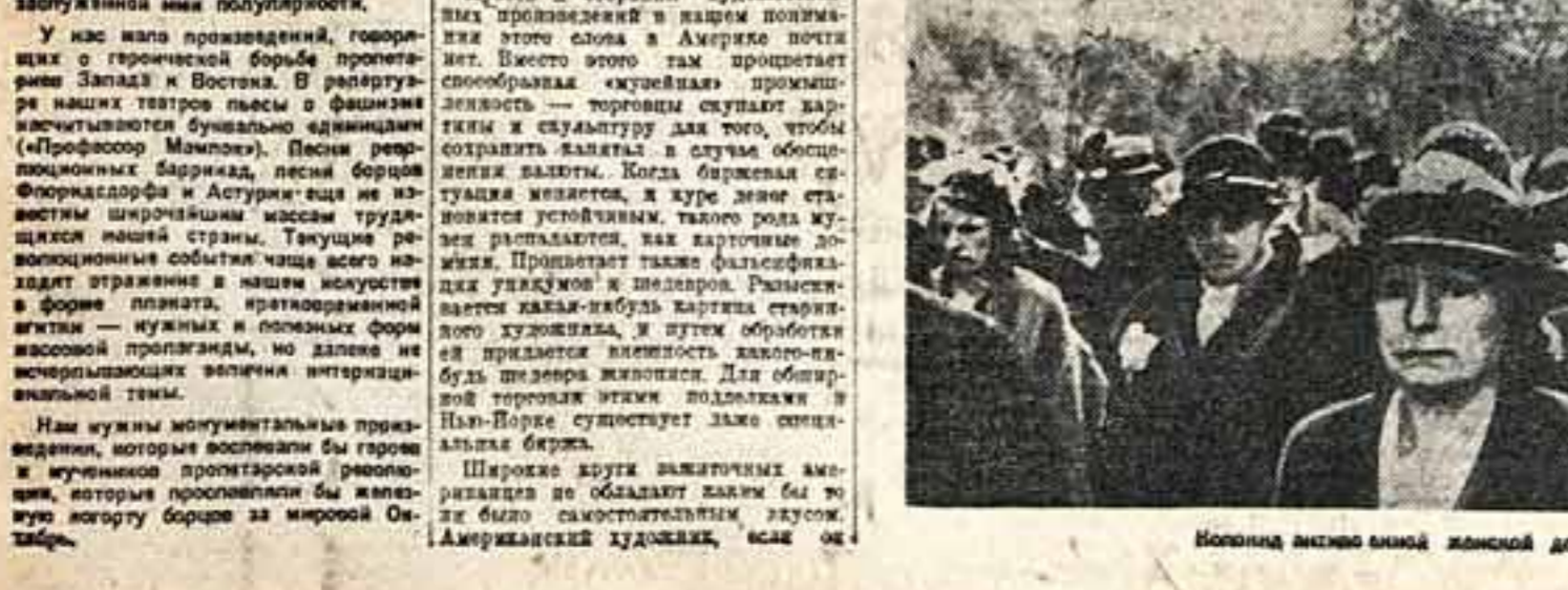
Концерт актрисы в женской демонстрации в Гае