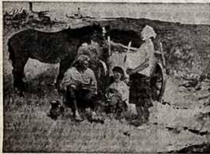
В. УГАРОВ. «Возрождение».