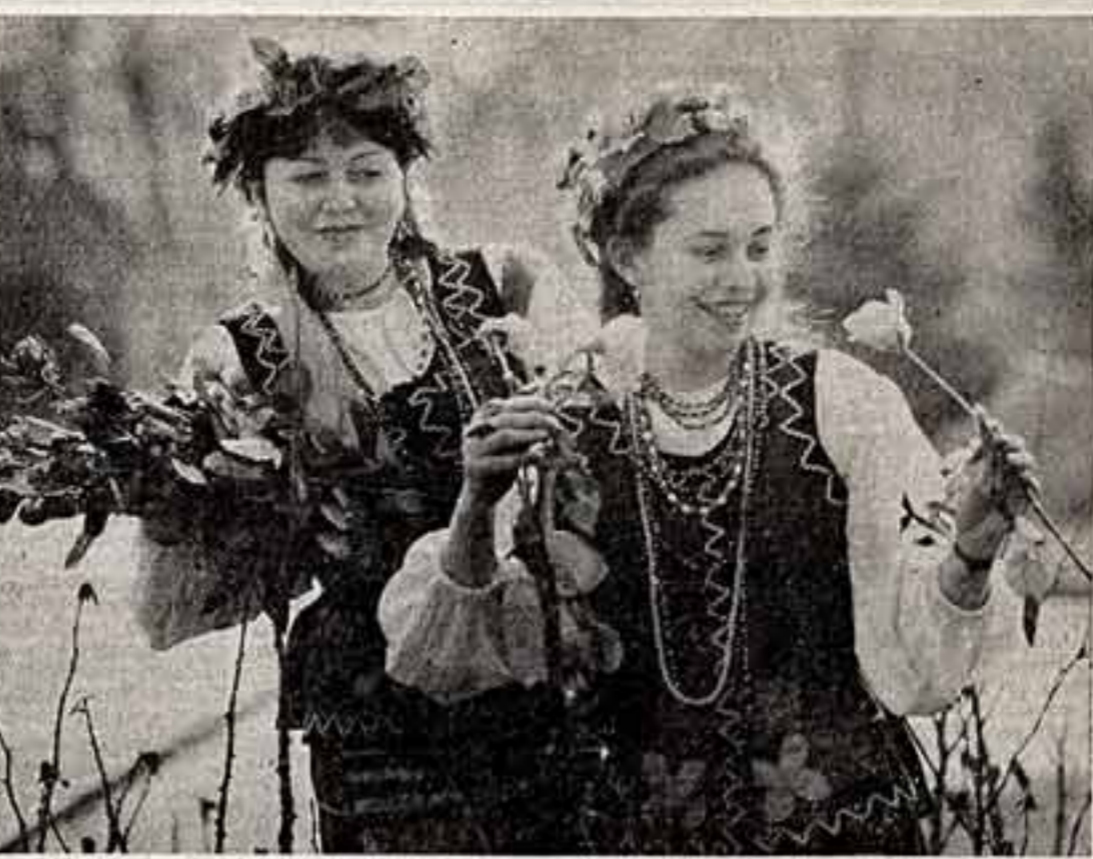
Донецк по праву называют «городом миллиона роз». Их выращивают в ботаническом саду, который основан двадцать лет назад.