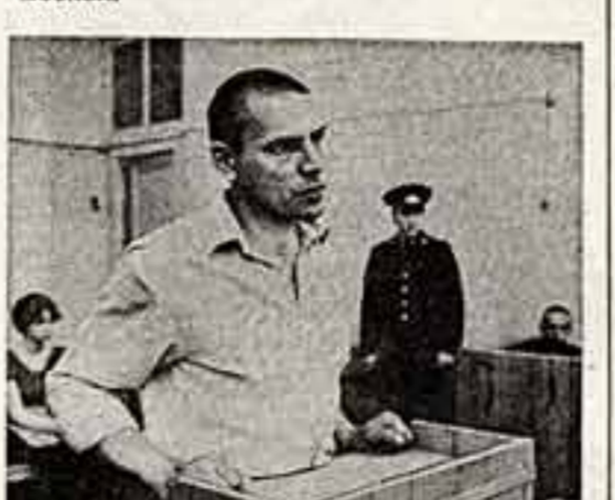
Кадр из фильма «Плაცы».