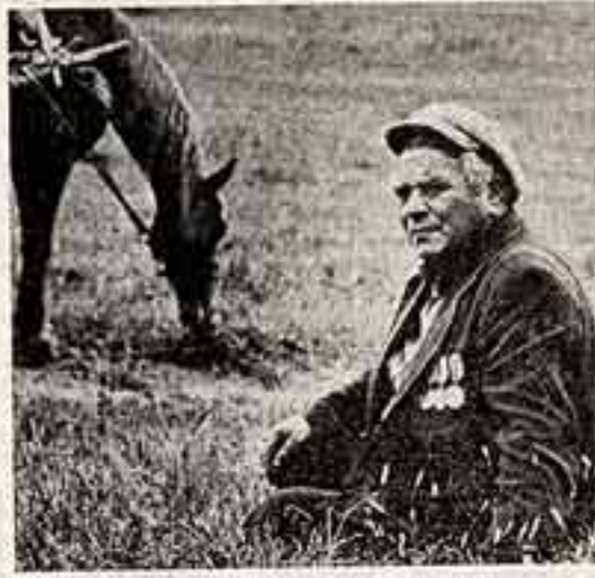
да встречались очевидцы событий, хочется узнать о них как можно больше. Жаль, что фрон- товики не отличаются особым красноречием.

«Многое связано у меня с этим танком...»