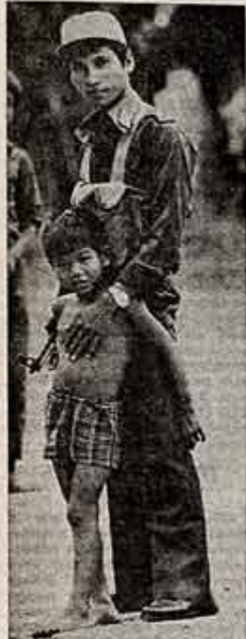
Камуфляж устроено шьет во вту строительства социалистического общества. На страже народных интересов стоят воины, защитники революционных завоеваний.