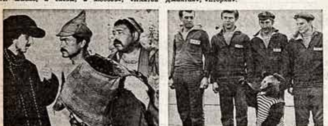
Кадр из фильма, представленного на XVIII Всесоюзном кинофестивале: «Лев Толстой», «И жизнь, и слезы, и любовь», «Клятва Дмитрия», «Егорка»