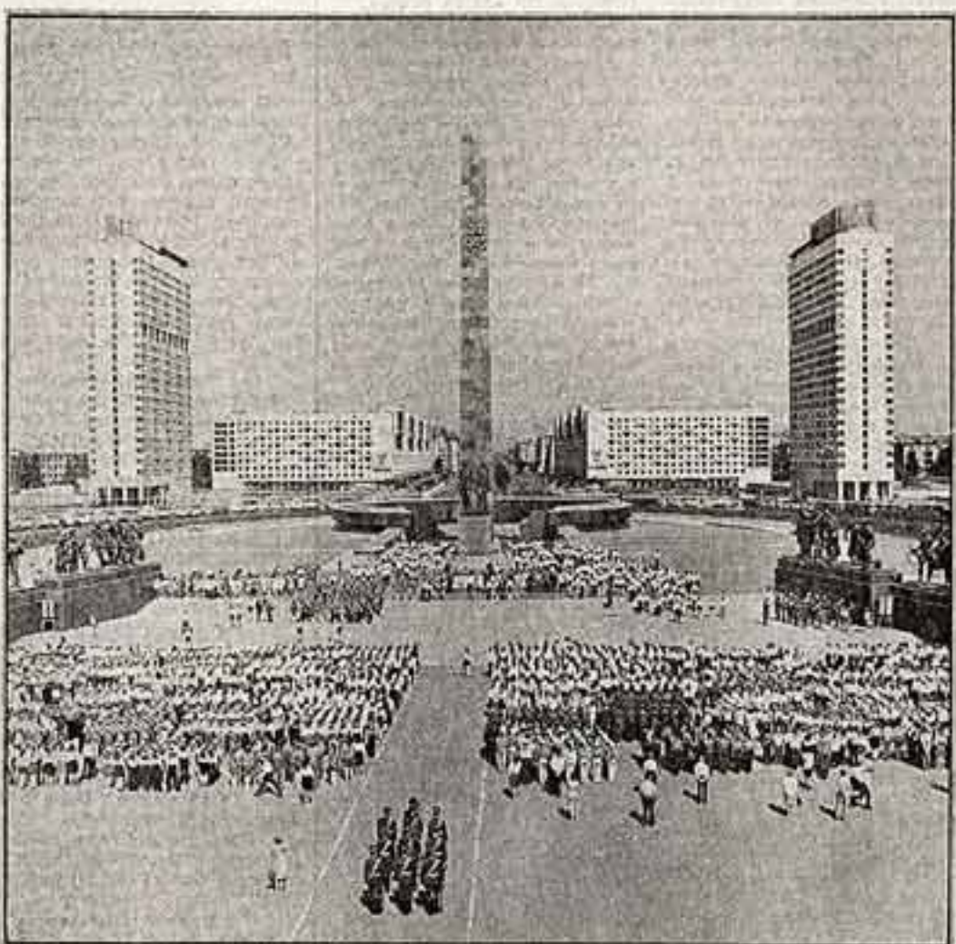
Ленинград. Площадь Победы.