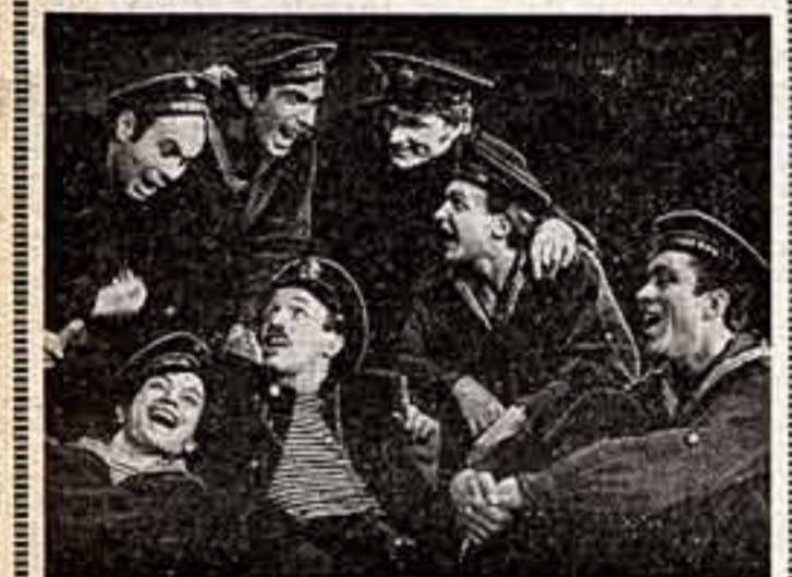
Сцена из спектакля «А музы не молчали...»