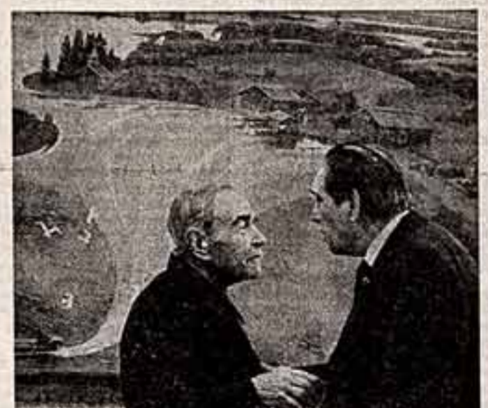
М. АЛПатов, действительный член Академии художеств СССР.