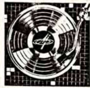
Около 4 миллионов экземпляров выпускают ежегодно на московской оптичной заводе «Грамматик» фирм «Мелодия». С 1988 года завод перешел на промышленное изготовление ленточных дисков для записи оригиналов по технологии фирм «Теладек» ФРГ.