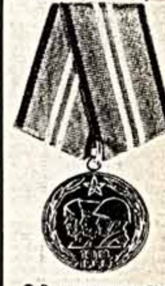
● В ознаменование 70-летия Вооруженных Сил СССР учреждена юбилейная медаль «70 лет Вооруженных Сил СССР».