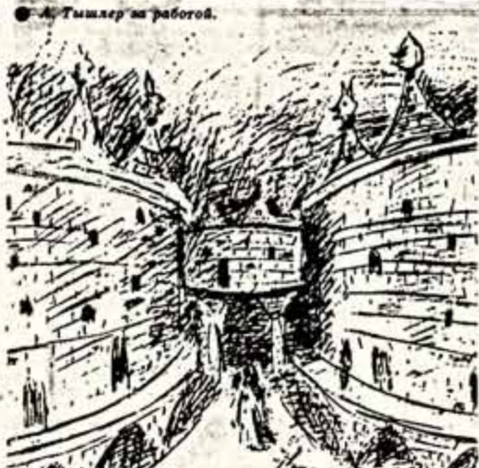
Эскиз единой декорационной обстановки к пьесе В. Шекспира «Ричард III» (1935 г.).