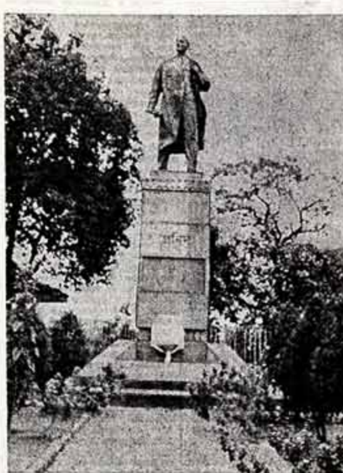
В деловом центре Калькутты возмещается памятник В. И. Ленину работы советского скульптора, народного художника СССР И. Тоцкого...

Исполнилось 160 лет со дня основания Пражского национального музея... ЮБИЛЕЙ ПРАЖСКОГО МУЗЕЯ