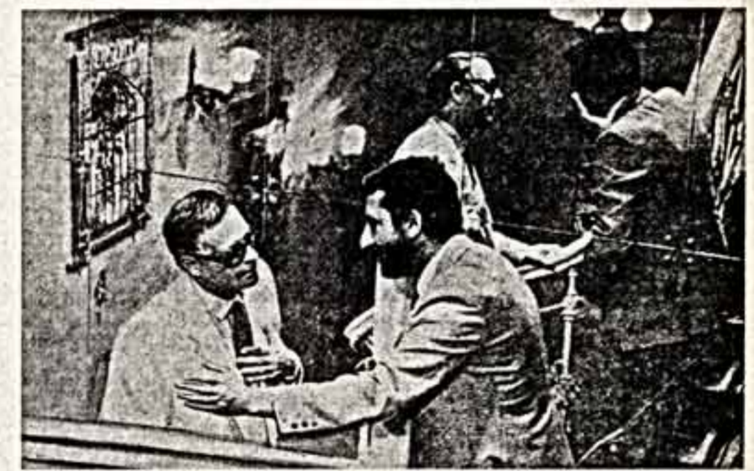
Чили. Расстрелянные души