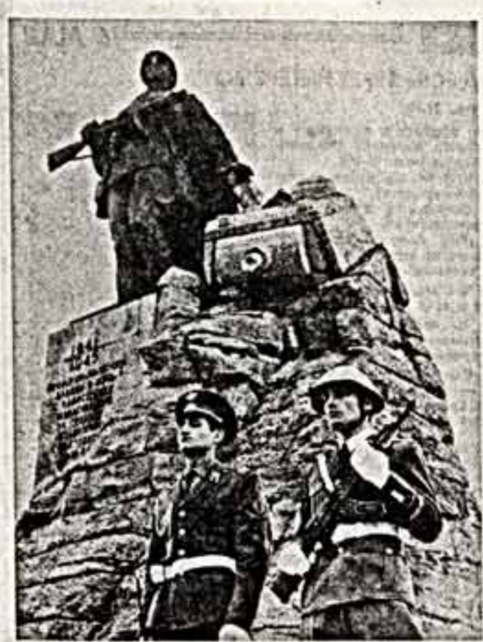
Почетный караул у памятника советскому воину-освободителю на Зеленом мысу в округе Франкфурт-на-Одере.