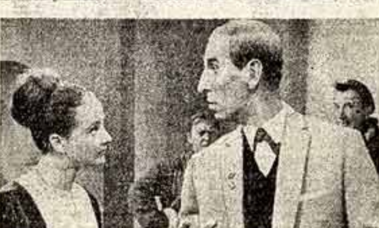
Надпись из кинокомедии «Зайчики».