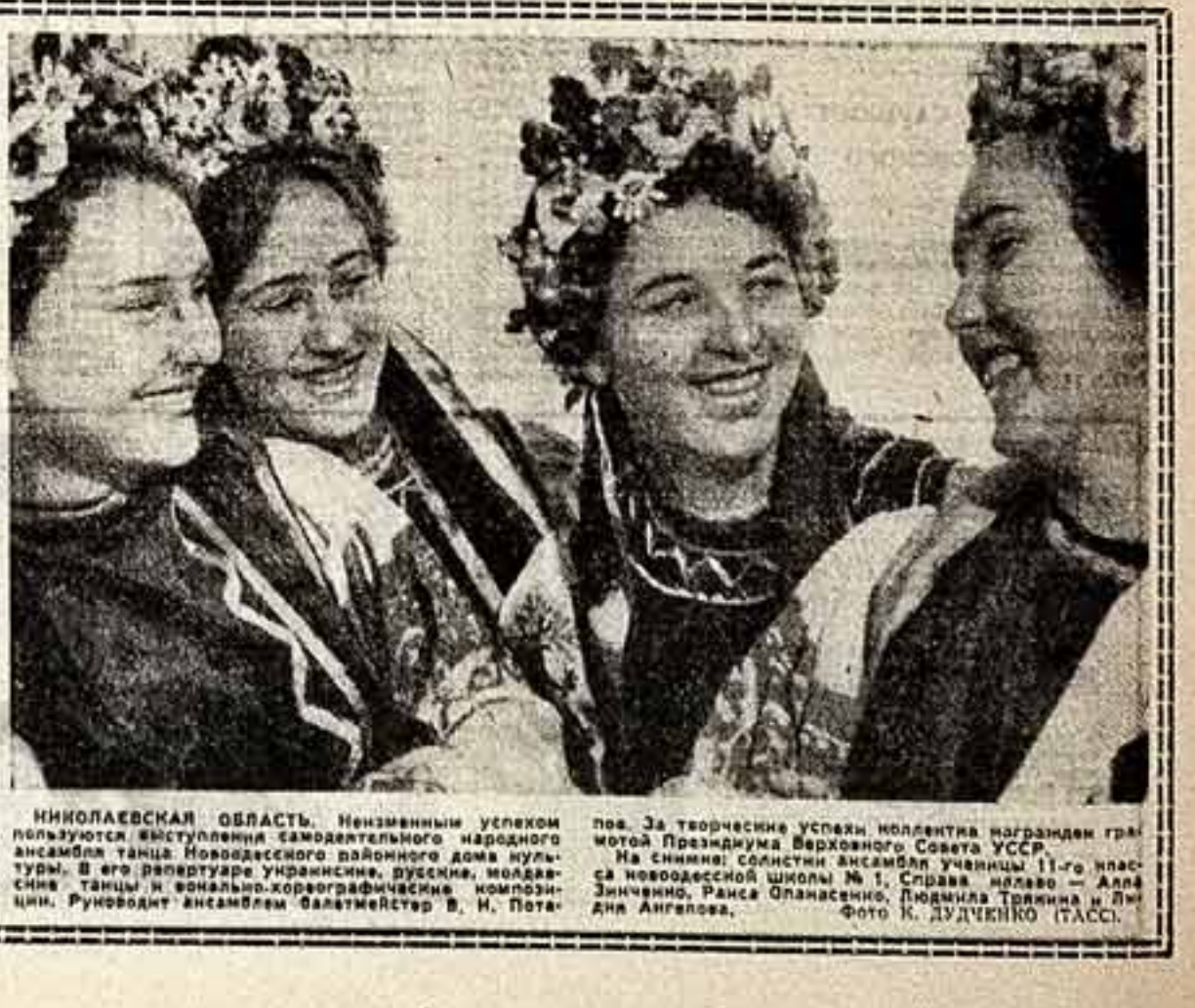
КИНОВАЕСЕЛЕНИЕ. Незаменимым успехом пользуются выступления самодельного народного ансамбля танца Новоградского района Украины...