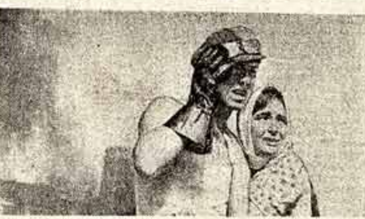
Если человек теряет веру, старается уйти от истины, заменив ее сладкой полуправдой... это катастрофа.