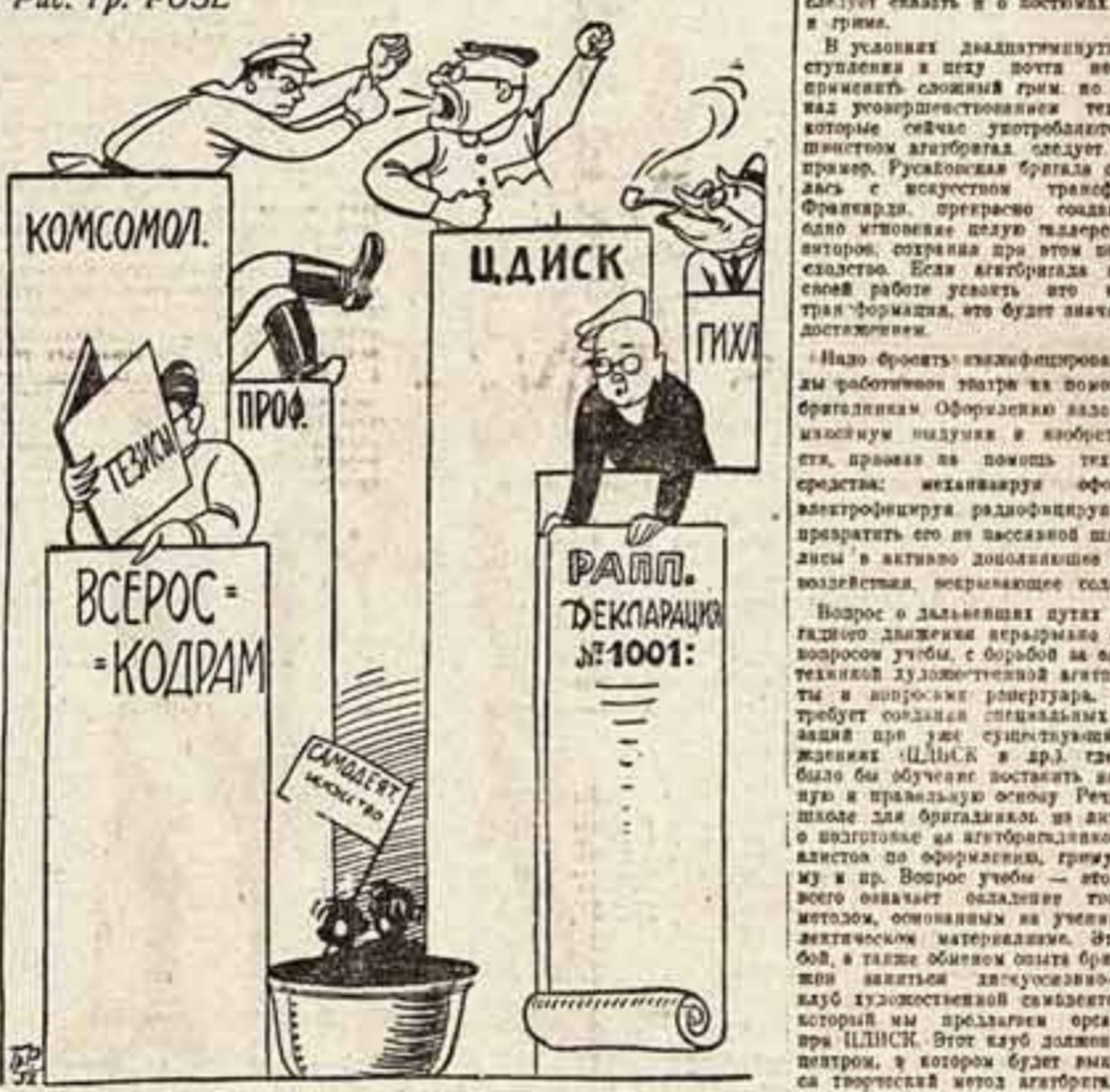
Дискуссия о ликвидации безпробности