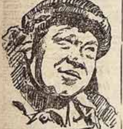
Артист И. М. из известной „Утопия в жизни“

Вопросы кинообразования. Личностный подход к обучению актеров является одним из самых важных. Это связано с тем, что киноактер должен быть не просто исполнителем, а творцом. Актеры того времени были не просто исполнителями, а творцами. Они работали вместе с режиссерами, сценаристами и другими членами съемочной группы. Этот подход к актерскому искусству позволил создать образы, которые были бы не просто выдумкой, а отражением жизни. Актеры стали активными участниками производственного процесса. На все это возмущаются некоторые критики, но это возмущение является лишь проявлением невежества. Актеры того времени были не просто исполнителями, а творцами. Таким образом, киноактер должен быть не просто исполнителем, а активным участником производственного процесса.