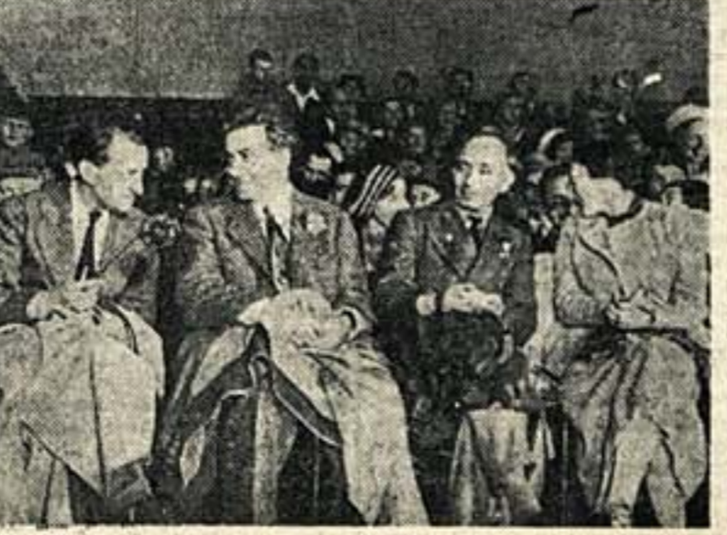
Писатели — делегаты съезда — на трибуне Зеленого театра