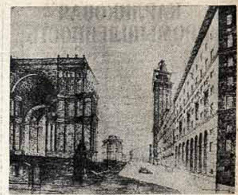
Проект планировки Пушкинской площади; арх. Гурко и Емелин

СПРАВКИ и ЗАПИСИ ЕЖЕДНЕВНО в КАНЦЕЛЯРИИ ТЕАТРА (АРБАТ, 26) с 12 час. ДО 5 ЧАС. ВЕЧЕРА ОБЩЕЖИТНОМ УЧИЛИЩЕ НЕ ОБЕСПЕЧИВАЕТ