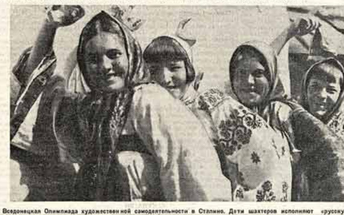
Воспитательница Олимпиада художественной самодеятельности в Сталине. Дети шахтеров исполняют «русскую».

21 августа в Государственном музее вообразительных искусств открылся выставочный зал, посвященный советской Туркмении.