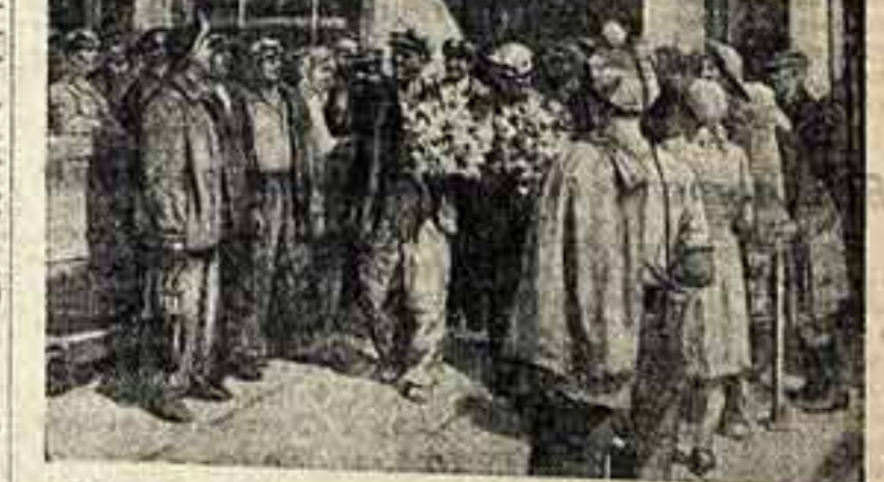
Н. Пономарев. «Встреча победителей социалистического соревнования». (Художественная выставка 1950 года).

Много светлой жизневажности и непосредственности в рисунке «Перед парадом: в ожидании сигнала в шахту для горняка, окруженные стаями товарищей, срываются в шахты».