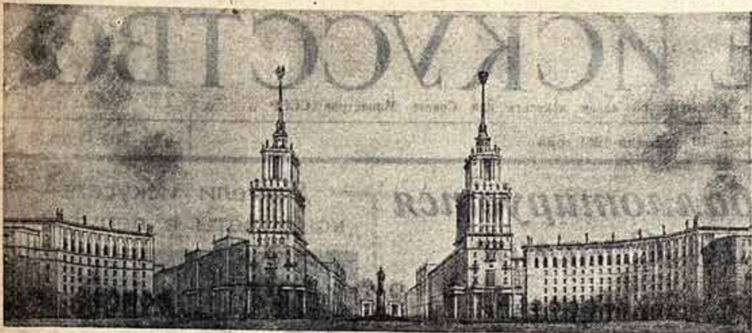
Проект имени И. В. Сталина в Ленинграде. Эскизный проект в'езда в город. Авторы — архитекторы В. Журавлев и В. Васильковский.