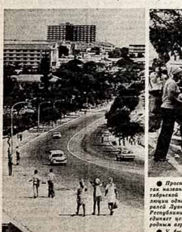
Вечер в столице Республики Ангола. Проект строительства центра столицы с международным аэропортом.