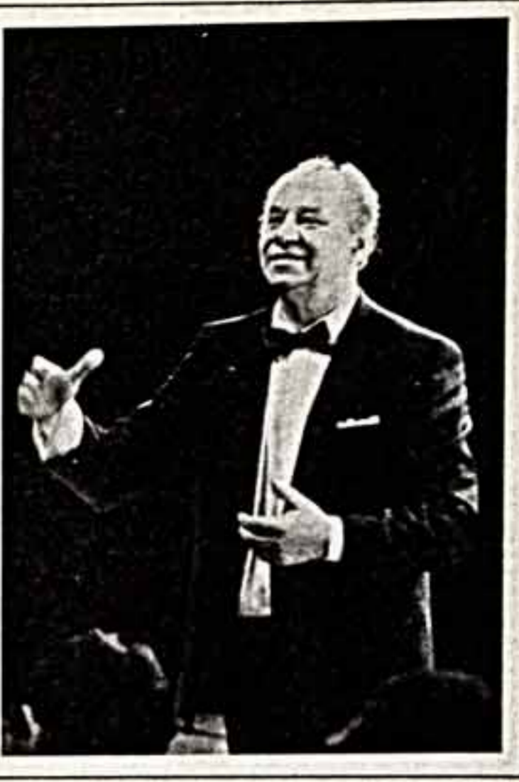
30. Да, в нынешнем году ансамбль Московского дворца пионеров и школьников имени В. Листова исполнит постановку. Более семнадцати тысяч ребят прошли за эти годы настоящую школу эстетического воспитания...