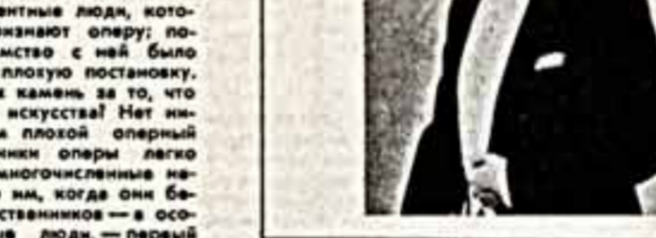
Мне бы хотелось, чтобы они прожили свою жизнь с удовольствием.