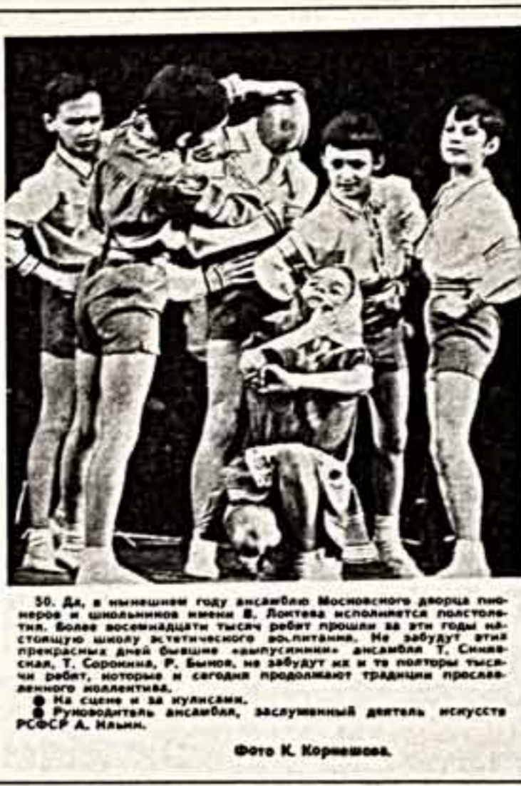
30. Да, в нынешнем году ансамбль Московского дворца пионеров и школьников имени В. Листова исполнит постановку. Более семнадцати тысяч ребят прошли за эти годы настоящую школу эстетического воспитания...