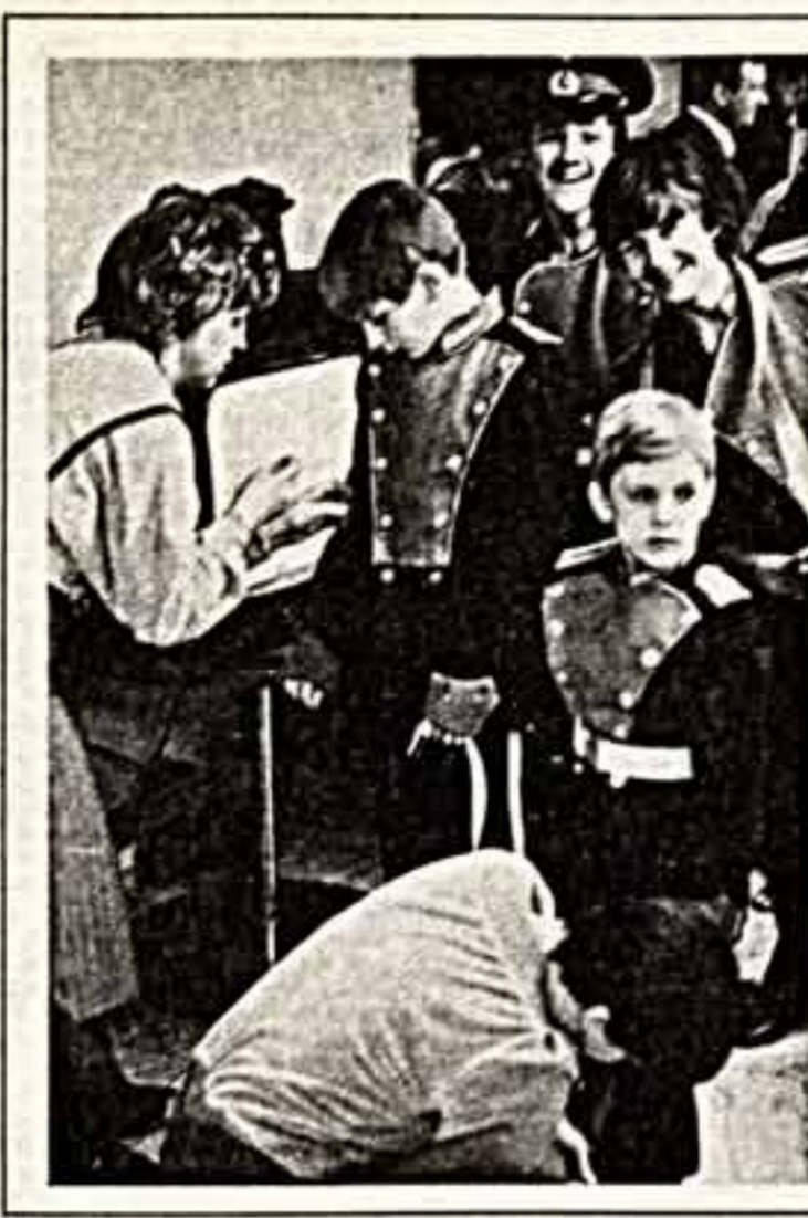
30. Да, в нынешнем году ансамбль Московского дворца пионеров и школьников имени В. Листова исполнит постановку. Более семнадцати тысяч ребят прошли за эти годы настоящую школу эстетического воспитания...