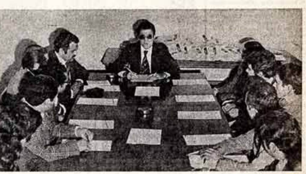
Свой афганский литературный талант и свое умение в Афганистане переводились книги русских и советских писателей.

Амин и его банда сделали все, чтобы поставить средства массовой информации на службу своим личным интересам.