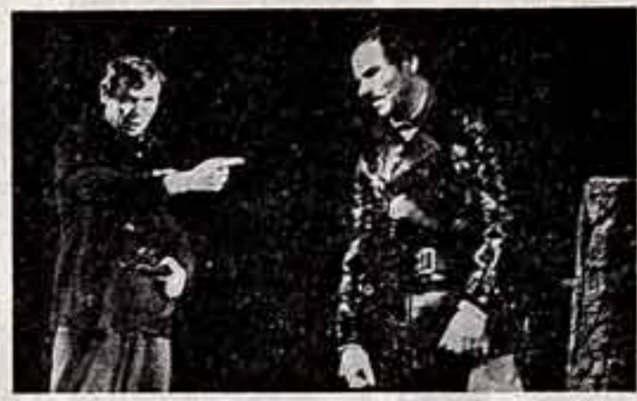
С успехом прошел на сцене Театра имени Моссовета спектакль «Соленная Падь» по роману Сергея Залыгина...