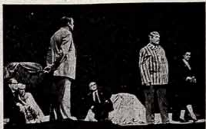
Ташкентский Государственный русский академический театр драмы имени М. Горького показал москвичам спектакль «Три года в плену»...

революцию Шаумяна! И зрители, вовлеченные по воле постановки в действие спектакля, тоже поднимают ружья!