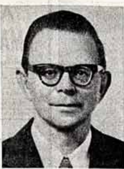
А. М. АЛЕКСАНДРОВ (АЛЕКСАНДРОВ-АГЕНТОВ)