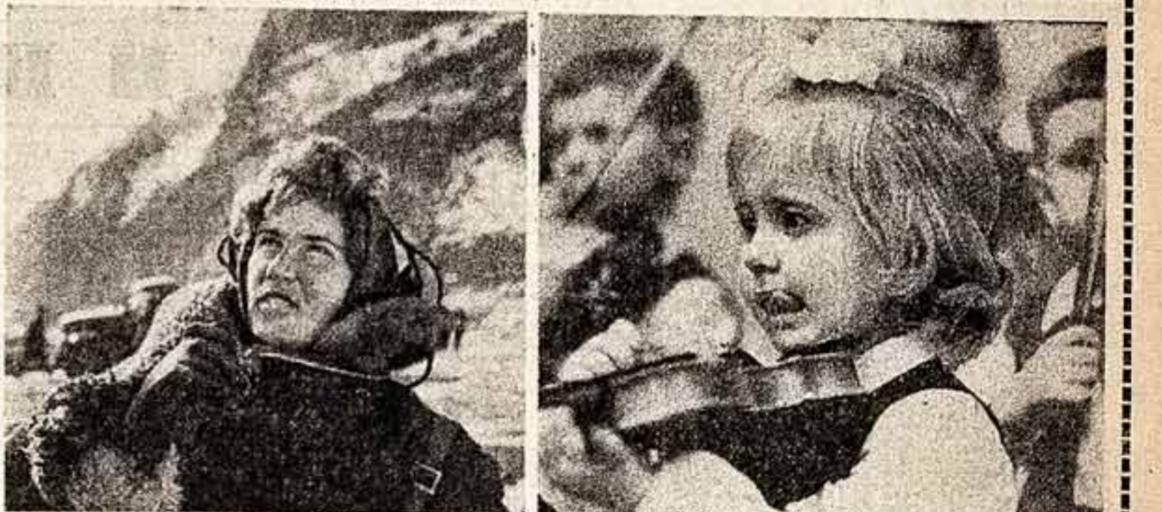
С ЕГО ДНЯ без минуты дактиля уплет последний кусочек хлебца старого года. Пройдет еще одна ступенька и заветный мечте. Встае еще одна вершина.