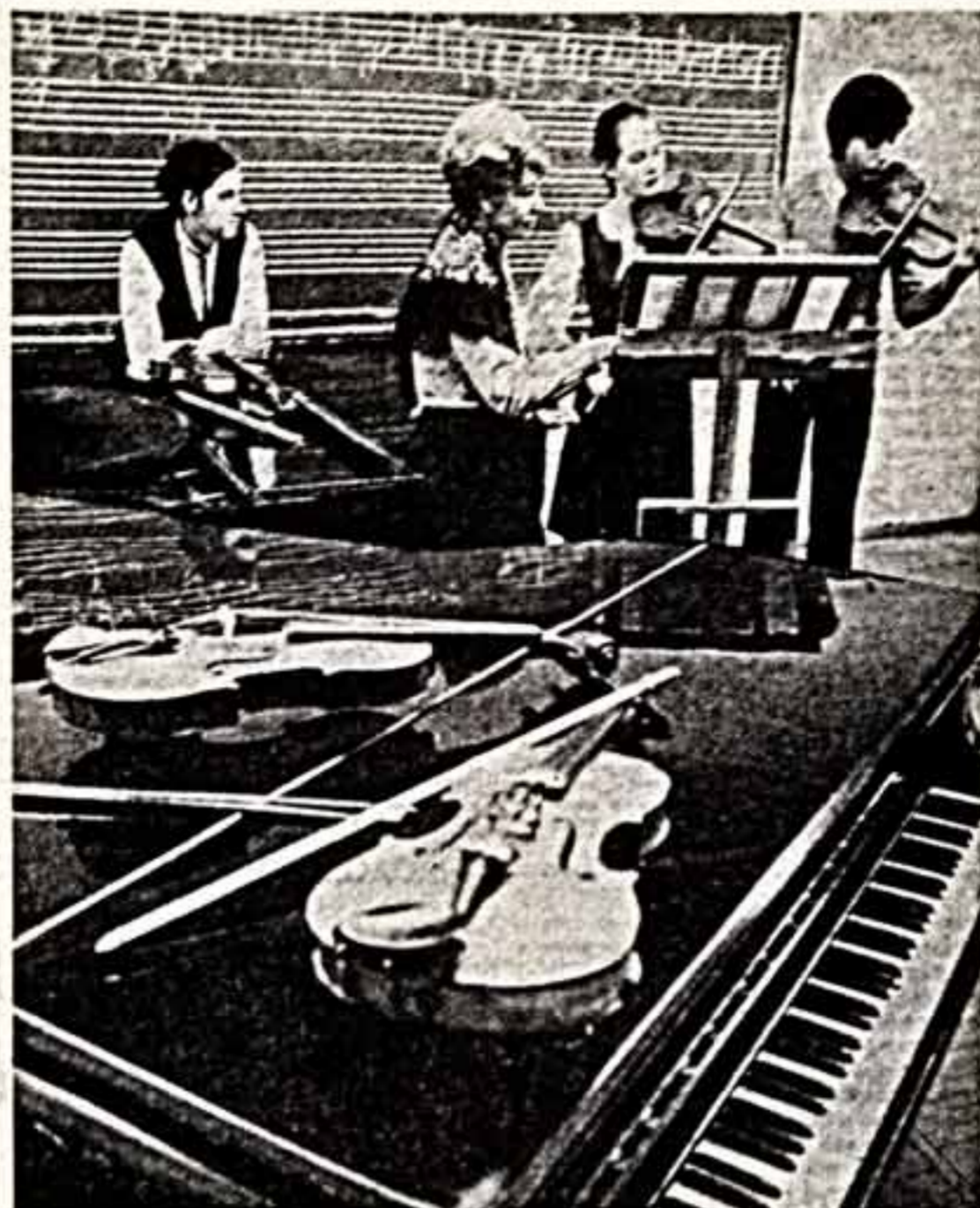
В будущем году Московская средняя специальная музыкальная школа имени Глинка ответит своим слушателям. Много талантливых музыкантов здесь свои образования. И сейчас в этом зале, полном музыки, учают около 350 ребят по четырнадцати специальностям.

В отделе вчерашнего, что на фабрике прислали отговорки на любой случайный вопрос...»