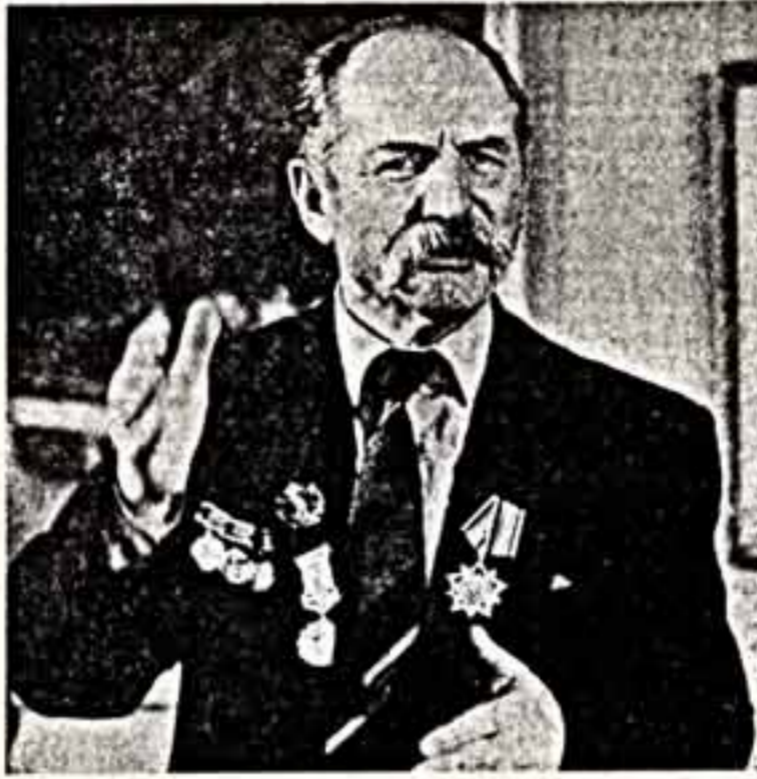
В Иркутске открыта выставка работ народного художника РСФСР Виталия Сергеевича Роголя. Художник приурочила к 70-летию со дня рождения сибирского живописца и полководецу юбилей его творческой деятельности...