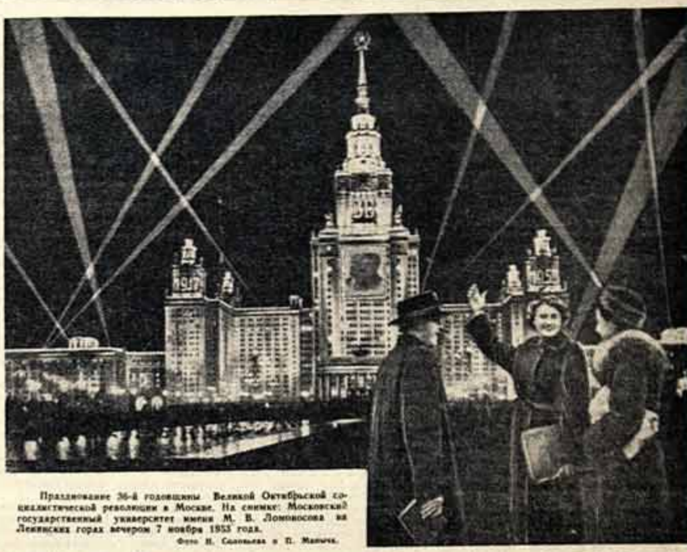
Празднование 36-й годовщины Великой Октябрьской социалистической революции в Москве. На снимке: Москва со стороны Ледяных гор вечером 7 ноября 1953 года.

Воскитайская ассоциация работников литературы и искусства. Союз писателей Китая. Союз театралов работников Китая. Союз художников Китая. Союз композиторов Китая. Общество по изучению восточного фольклора.