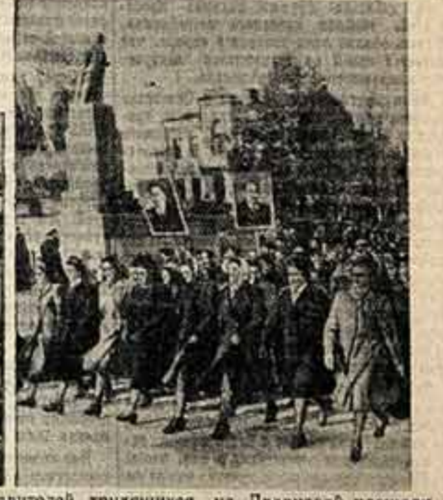
На снимках (слева направо): демонстрация представителей трудящихся в Москве, Парад войск Московского гарнизона на Красной площади. Демонстрация представителей трудящихся на Дворцовой площади в Ленинграде. Демонстрация представителей трудящихся на площади Победы в Кшинеце.