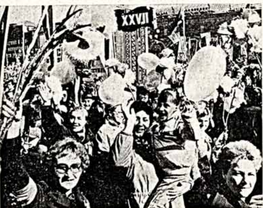
Да здравствует Первомай!

«Сегодня Первомай ровно сто лет. 1 мая 1886 года рабочие Америки вышли с красными знаменами на улицы Чикаго защищая свои права. Завоевая их в борьбе, оплывая кровью, пролитой в борьбе, сегодня этот праздник приносит свободу, равенство, братство. И потому взоры миллионов жителей земли обращены в этот день к стране, на знамени которой начертано: