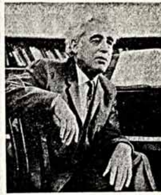
Ставкин двухтомный труд «Туркменская музыка».