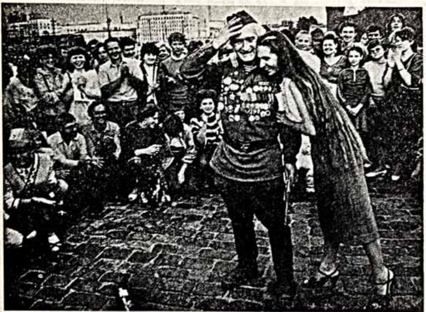
ФОТОКОНКУРС ● Б. КАУДНН. «Трагедия старинной»