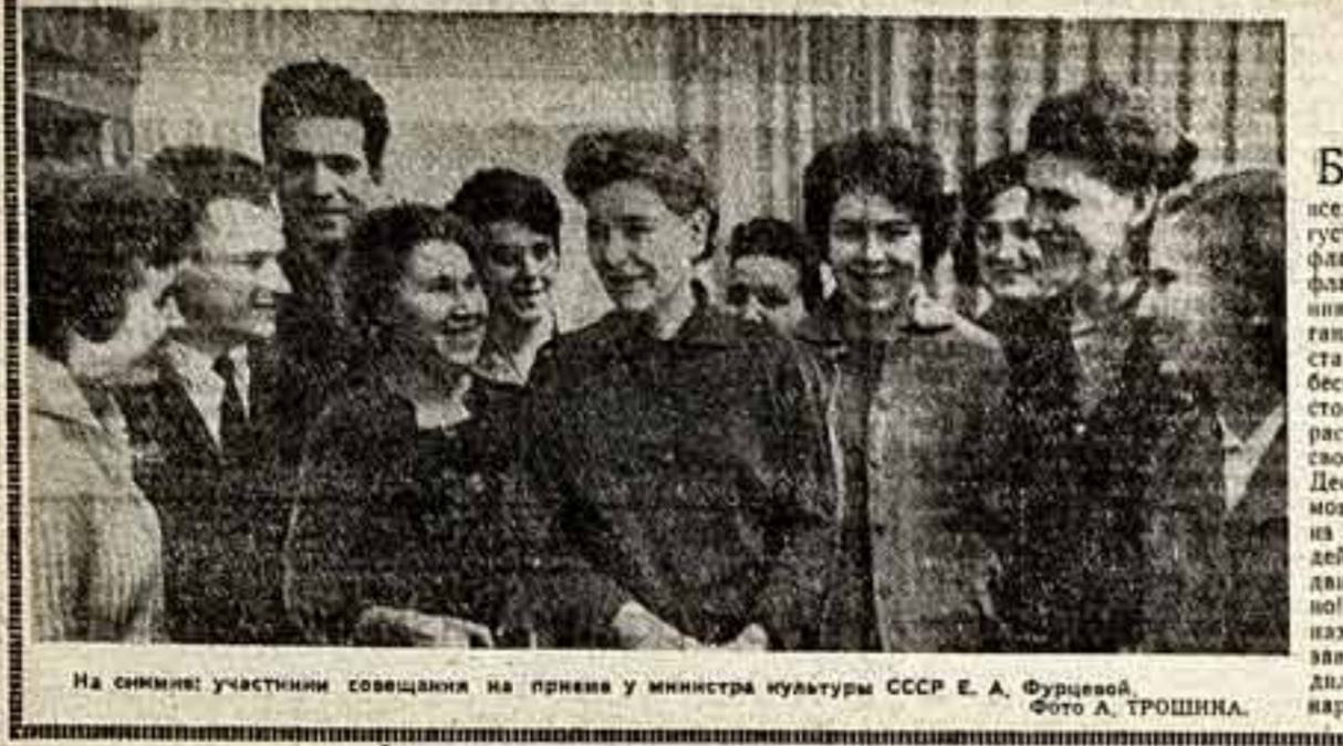
На снимке: участники совещания на приеме у министра культуры СССР Е. А. Фурсей.