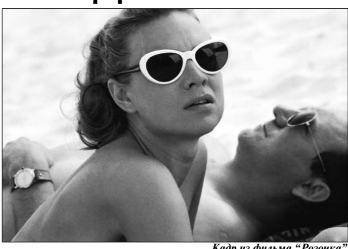
Кадр из фильма "Розочка"