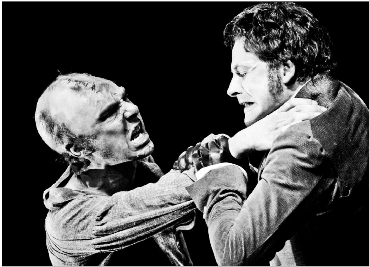
Д. Ли Миллер – Франкенштейн и Б. Камбербэтч – Создание

Роман Мэри Шелли поставили в лондонском театре