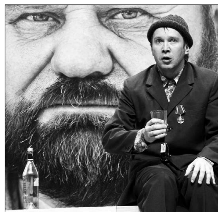
Е. Миронов в спектакле "Рассказы Шукшина"