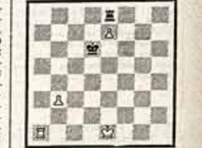
Этот поучительный этюд создаст шахматный композитор из Харькова...