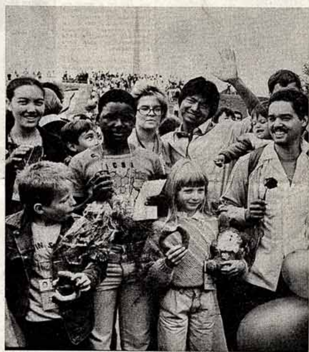
XII Всемирный в гостях у советских детей во Дворце пионеров и школьников.