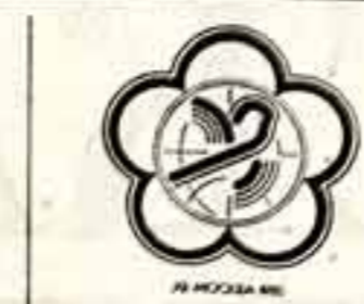
2 августа на XII Всемирном фестивале молодежи и студентов отмечался День СССР.