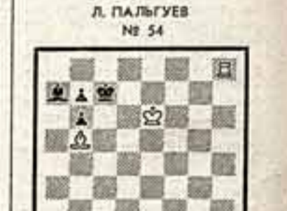
Поиск решения приведет вас к положительному ответу на заданный вопрос...