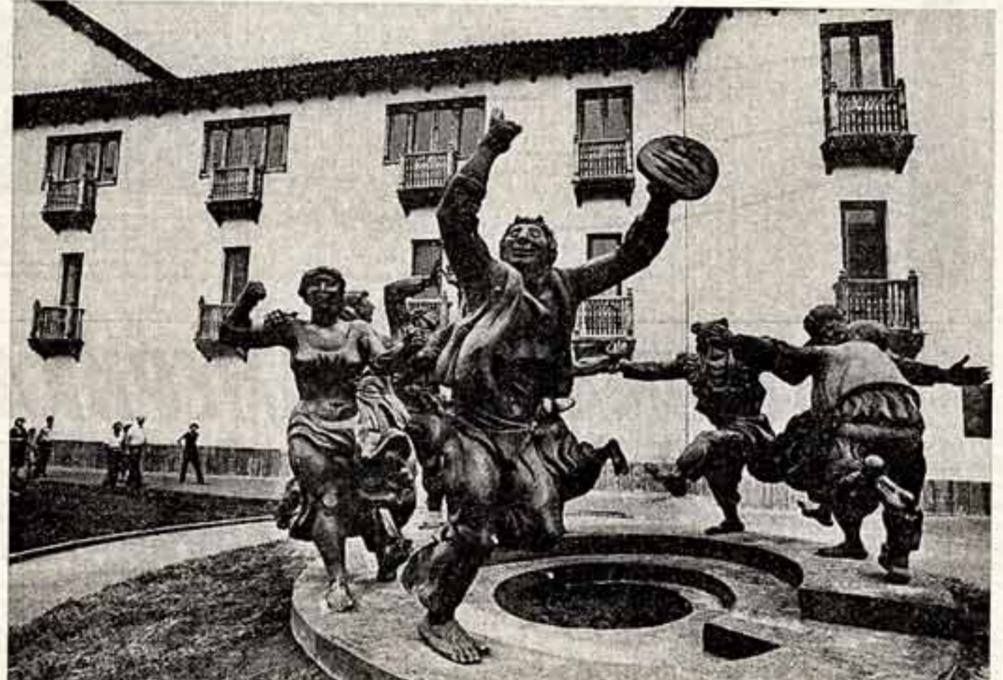
В. ЧЕШВИЛИ. «Картинки старого Тбилиси»