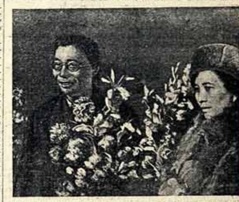
В Москву для участия в фестивале...