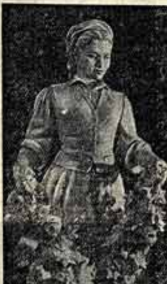
«Звезда». Скульптура А. Иванова, подготовленная к представлению в Узбекистане искусства и литературы в Москве.