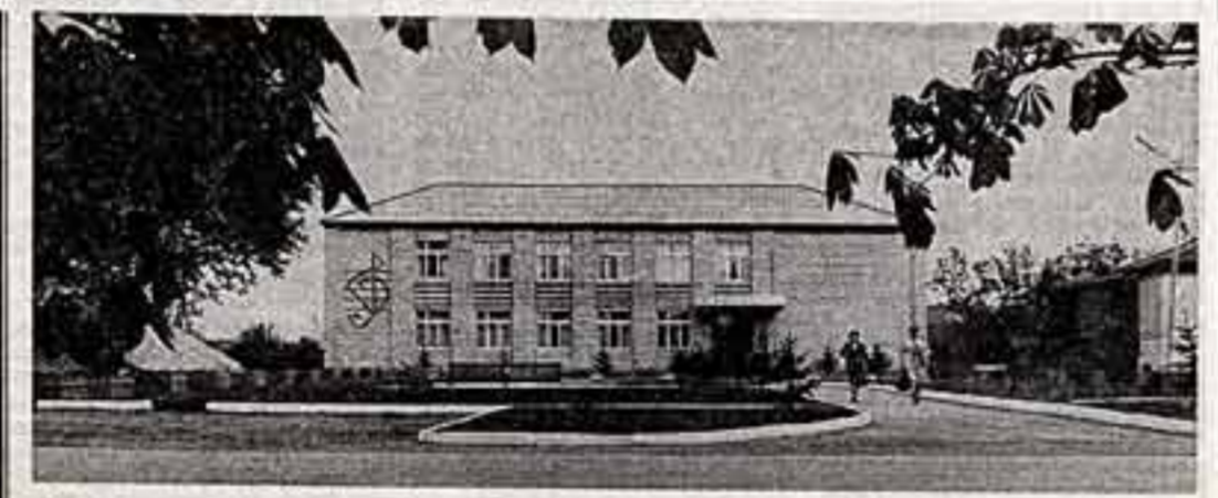
Здание музыкальной школы. Замятие ведет педагог Е. Сушицкий.