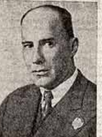
Владимир ДАВЫДОВ, народный артист РСФСР.