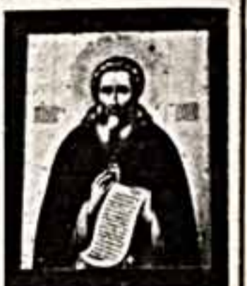
Впервые зрители увидят в нашей стране развитие в творчестве Андрея Рублева. На выставке демонстрируются знаменитые произведения иконописцев: «Спас в славе», «Спас в пустыне», «Спас в раю», «Спас в горах», «Спас в долине», «Спас в саду», «Спас в поле», «Спас в лесу», «Спас в степи», «Спас в горах», «Спас в долине», «Спас в саду», «Спас в поле», «Спас в лесу», «Спас в степи».

Во всеобщем музееобразном «Государственном Третьяковском галерее» открылась выставка «Иконы русской иконописи». Для этой экспозиции отобрано 120 произведений из богатейшей коллекции русской иконописи. Для этой экспозиции отобрано 120 произведений из богатейшей коллекции русской иконописи. Для этой экспозиции отобрано 120 произведений из богатейшей коллекции русской иконописи.