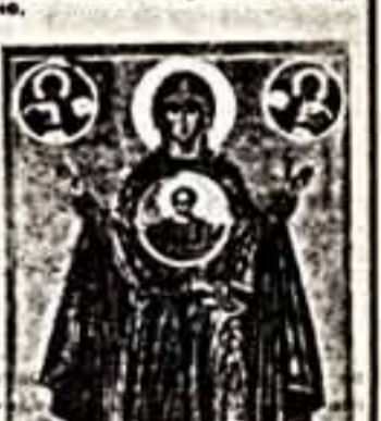
Довольно распространенным стало мнение, что развитие русской иконы обрывается в XVII веке работами знаменитых мастеров Оружейной палаты, иконописцев Симона Ушакова. На самом деле мнение продолжало плодотворно развиваться вплоть до начала XIX века. Этот иконоисследовательский труд русской иконописи иконописцев представлен на выставке произведениями иконописцев: Симона Ушакова, Ивана Мухоморова, Степана Покровского, Степана Покровского, Степана Покровского.

Наиболее совершенная иконописная школа — иконописцы — выдвинула в творчестве Андрея Рублева. На выставке демонстрируются знаменитые произведения иконописцев: «Спас в славе», «Спас в пустыне», «Спас в раю», «Спас в горах», «Спас в долине», «Спас в саду», «Спас в поле», «Спас в лесу», «Спас в степи».