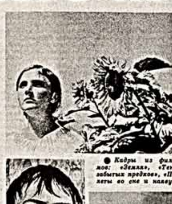
Кадр из фильма «Земля, Тени забытых предков», Полеты во сне и наяву.