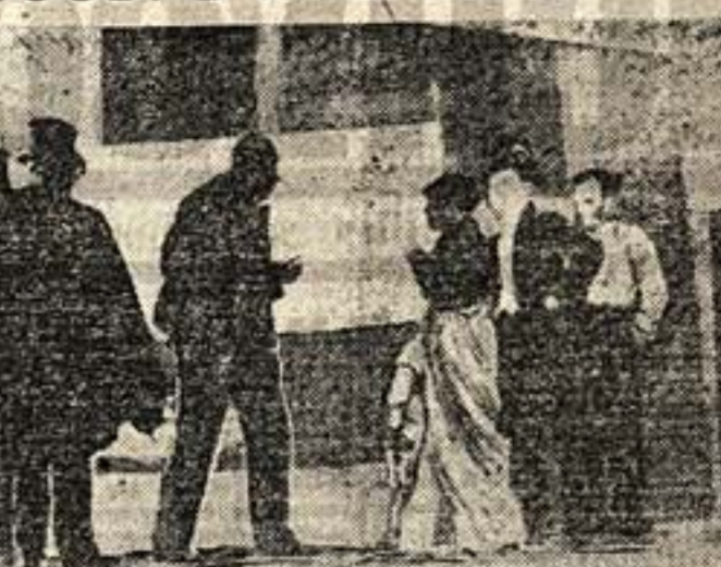
В. Э. Меерхольд на репетиции «Дамы с камелиями»

Он был образованнее нас (он пришел к нам прямо на университет), опытный, как актер (пеленский драматический кружок), а главное, он был талантливей и активней из нас. Вот характеристика, которую дал ему в это время (при переходе его с второго курса на третий) наш