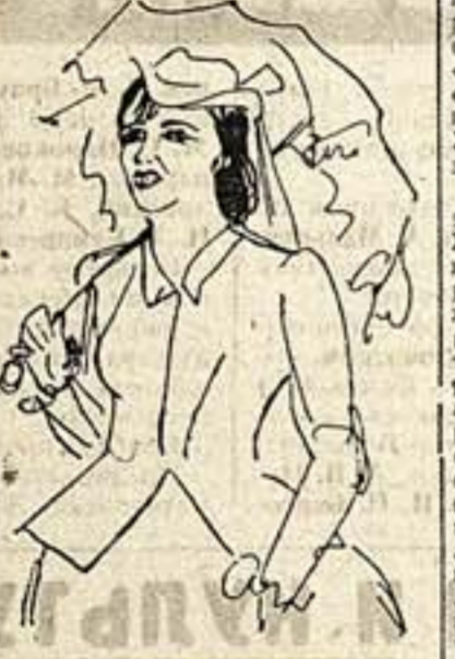
Выражение — Спекторская

бессмыслица, в мелочных заботах и в тупом труде ремесленного квартала Гут-Дор.