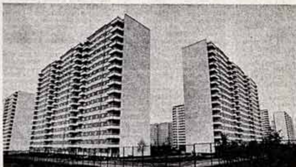
Поднимаются этажи Олимпийской деревни.

Постоянная пропаганда лучших образцов классической и современной музыки, высокий профессиональный уровень исполнительского мастерства, строгий контроль за выполнением намеченных планов — необходимые условия плодотворной работы по эстетическому воспитанию трудящихся, по выполнению важнейших задач, выдвинутых постановлением ЦК КПСС «О дальнейшем улучшении идеологической, политико-воспитательной работы».