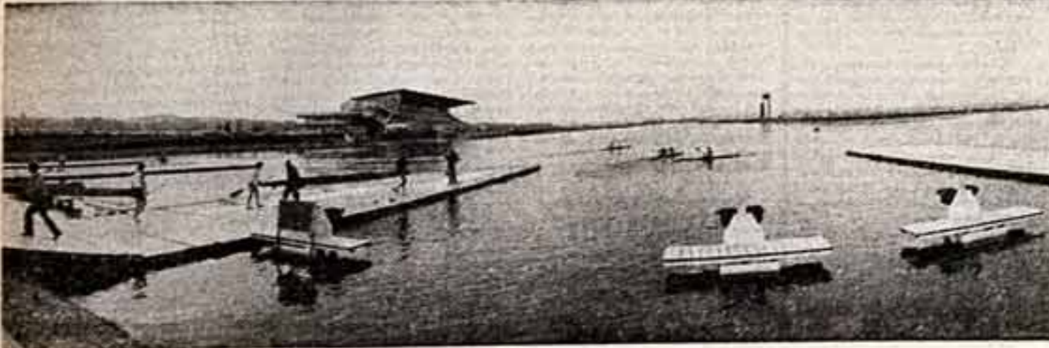
На гребной канале в Крылатском.