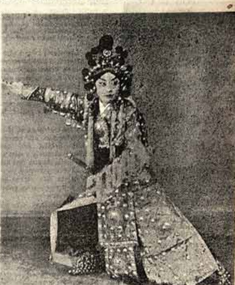
Май Лань-фан в пьесе «Му-Лан в армии»