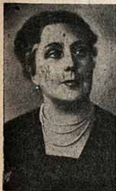
Председатель Совета Всероссийского театрального общества народная артистка республики А. А. Яблочникова