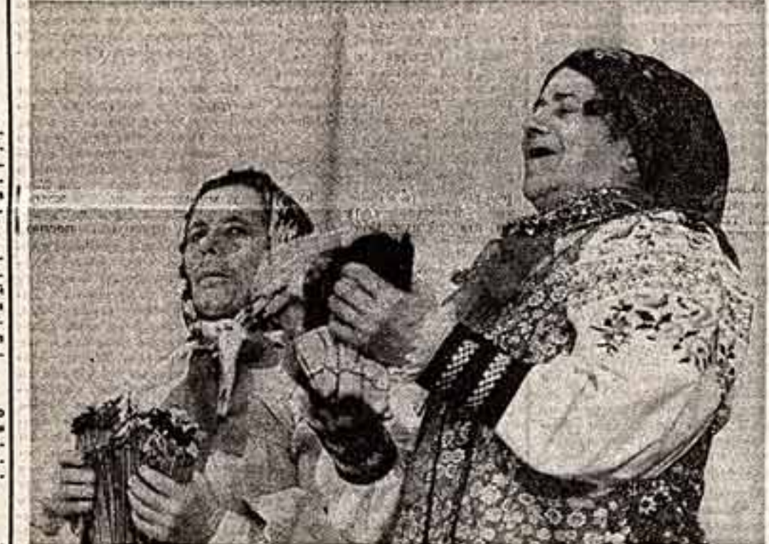
С большим успехом в Москве прошли музыкально-этнографические концерты самодеятельных фольклорных коллективов России, организованные фольклорной комиссией Союза композиторов РСФСР и Всероссийским обществом охраны памятников истории и культуры. Хорошие и славные песни привез на сцену женский ансамбль села Волого Ветского района Тульской области. Они из фольклорного хора колхоза им. Кирова Репьевского района Воронежской области.

НОВОКУЗНЕЦК. Здесь построен Дом политического просвещения. В нем два зала — на 800 и 300 мест, многочисленные аудитории. Библиотека дома вмещает 70 тысяч томов. ВОЛЬСК (Саратовская область). «Во имя мира, безопасности и сотрудничества». Этим темой были посвящены занятия в девяти народных университетах города. Почти половина слушателей — молодые рабочие.