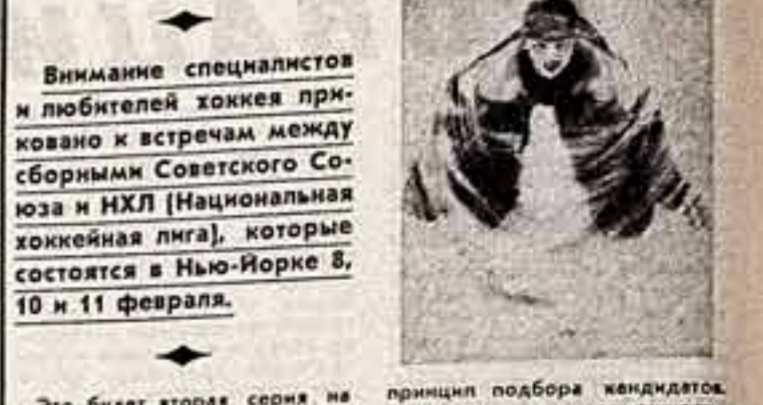
Внимание специалистов и любителей хоккея приковано к встречам между сборными Советского Союза и НХЛ (Национальная хоккейная лига), которые состоятся в Нью-Йорке 8, 10 и 11 февраля.

Это будет вторая серия на таком высоком уровне. Первая состоялась в 1972 году, и тогда команда НХЛ выиграла у сборной СССР. В этот раз сборная СССР будет играть с командой НХЛ «Нью-Йорк Айлендерс».