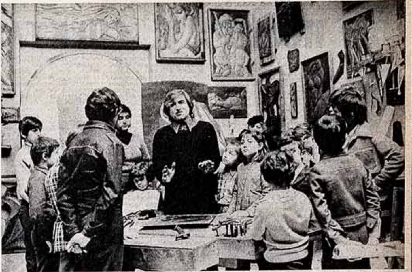
Сыновья стара работ, младшим из которых всего четыре года, в старшину пятачком, занимающую в микрорайоне областного центра...