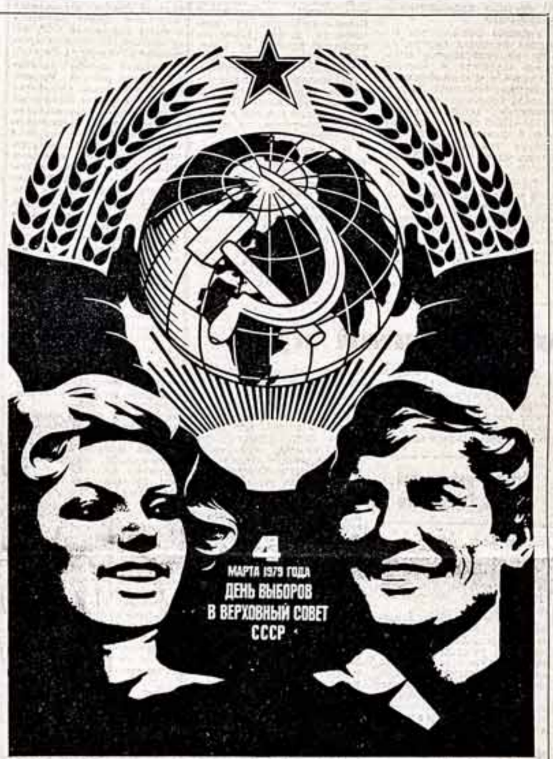
Этот плакат, работы художников Л. Бельского и В. Поголова, выпущен к предстоящим выборам в Верховный Совет СССР издательством ЦК КПСС «Плакат».